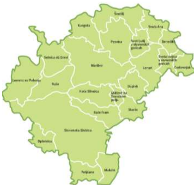
Slika 1: Območje 22 občin Zgornjega Podravja (Osrednja Štajerska)

Število prebivalstva v destinaciji predstavlja 11,6 % prebivalstva v Sloveniji, površina destinacije pa obsega 6,5 % vsega slovenskega ozemlja. V letu 2010 je povprečna stopnja brezposelnosti znašala 12,4 %, kar je za 15,8 % več od vseslovenskega povprečja.