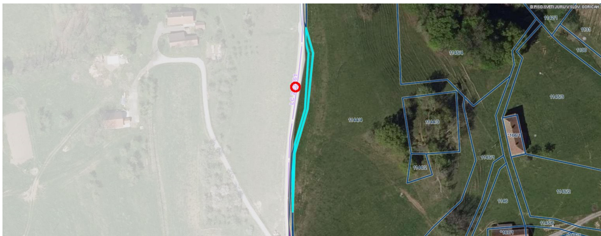
Skica parcele, kateri se odvzema status grajenega javnega dobra.

Ko postane odločba o ukinitvi statusa grajenega javnega dobra pravnomočna, jo občinska uprava pošlje sodišču, ki po uradni dolžnosti iz zemljiške knjige izbriše zaznambo o javnem dobru.