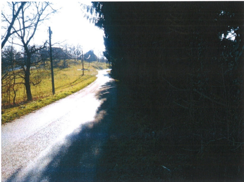
Jurovski dol – obrez vejevja