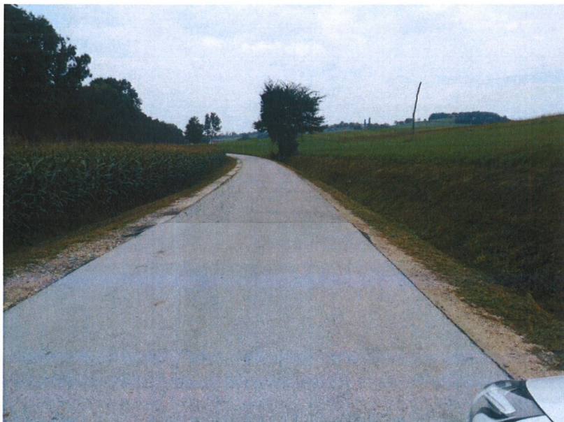
Jurovski dol – obrez vegetacije ob cesti