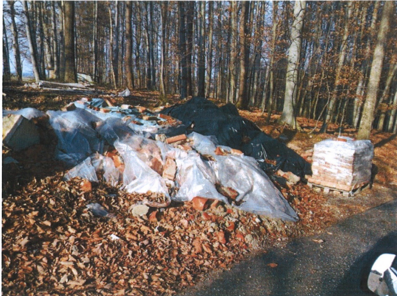
Malna – odloženi odpadki