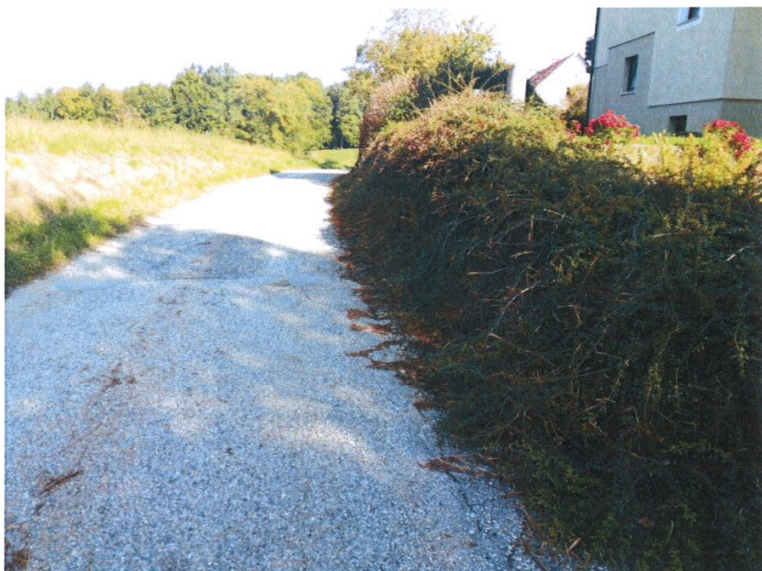
Vegetacija v svetli profil občinske ceste – prej