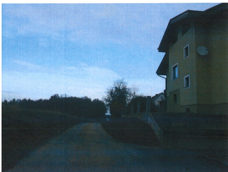
Vegetacija v svetli profil občinske ceste – in potem