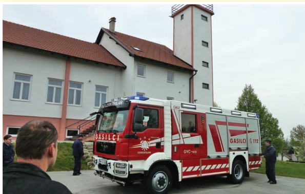
o Cerkvjenjaška društva hrbtenica dogajanja, gasilci že pripeljali novo vozilo