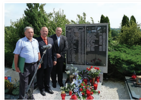
Odkritje spominske plošče

Da bi aktivnosti ob 20-letnici DIS in 70-letnici izгона Slovencev z njihovih domov med leti 1941-45 dostojno obeležili, smo tudi v Lenartu gostili razstavo o izgonu Slovencev in drugih slovanskih narodov, ki je bila pripravljena v razstavišču Centra Slo-