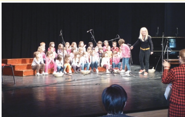
o Lenart: dvorana kulturnega doma zaživela, nastopili so že mladi plesalci in pevci