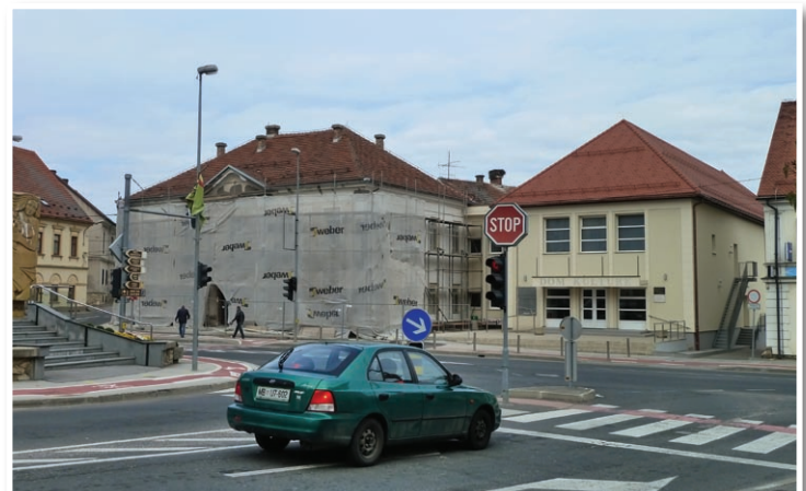
Ob Kulturnem domu je obnovo doživela še ena od osrednjih mestnih zgradb.

Občinski svet se je seznanil tudi s pregledom varnostne situacije na območju občine Lenart za leto 2011 in se seznanil s poročilom o delu Medobčinskega inšpektorata in redarstva za leto 2011.