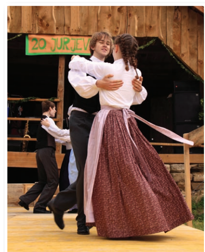
Prihod Zelenega Jurija so pozdravili tudi mladi folkloristi.