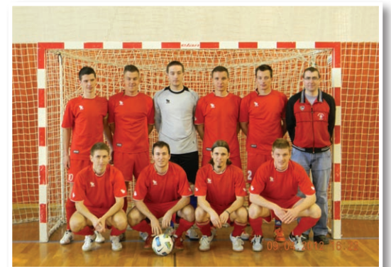
ŠD Zavrh 2. mesto v pokalnem tekmovanju MNZ Maribor