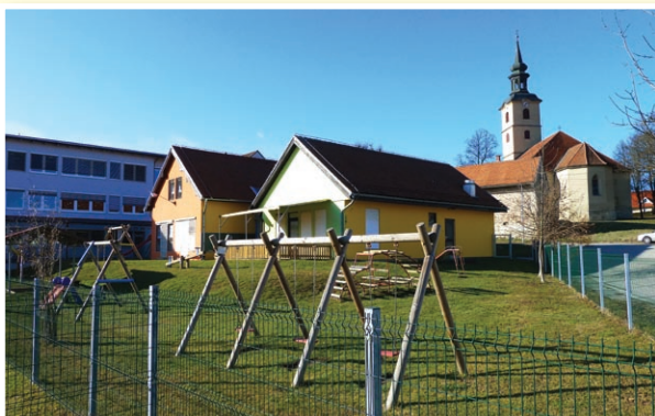
o Občina Benedikt s svojimi aktivnostmi sledi dolgoročnim razvojnim ciljem