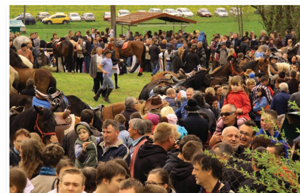
Kljub dežju je konje občudovalo veliko obiskovalcev.