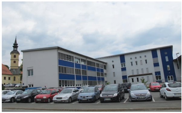
Občina Benedikt vzorno skrbi za osnovno šolo, saj se na občini zavedajo, da je v mladini prihodnost občine in kraja.

Na področju družbenih dejavnosti si občina v skladu s svojimi pristojnostmi prizadeva za zagotovitev ustreznih prostorskih zmogljivosti v vrtcu (zato so načrtovana potrebna vlaganja v nove kapacitete vrtca). Poleg tega občina zagotavlja potreben obseg sredstev za materialne stroške in redno vzdrževanje osnovne šole. Na področju športa in rekreacije pa občina posebno pozornost posveča organizirani dejavnosti ter čim večji dostopnosti športa in rekreacije čim širšemu krogu uporabnikov. V ta namen občina zagotavlja sredstva za programe društev za šport in rekreacijo. Občina s proračunskimi sredstvi pomaga tudi staršem ob rojstvu