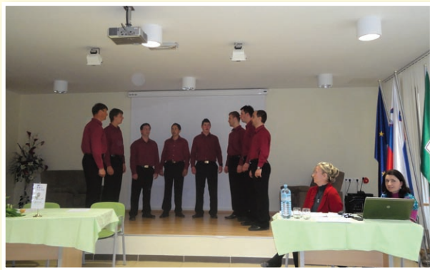
Nastop vokalne skupine Slovenskogoriški glasovi

Osnovno poslanstvo društva je izvajanje projektov v okviru ukrepa Leader; v obdo-