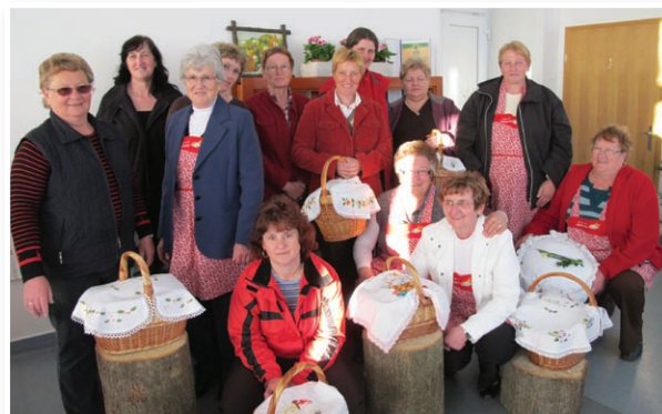
Članice Društva kmečkih žena in deklet Cerkvenjak, ki so med najbolj aktivnimi v kraju, saj brez njih ne mine skoraj nobena prireditev, so tudi letos organizirale čudovito velikonočno razstavo.