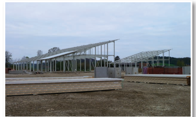
Sončna elektrarna v Žicah

Podan je bil tudi predlog sklepa o opremljanju stavbnih zemljišč za poslovno cono v Žicah. Tako bodo skupni stroški opremljanja zemljišč, ki obsegajo stroške projektiranja in gradnje komunalne opreme, znašali predvidoma okoli 320.000 evrov. Investicija pa naj bi se realizirala v celoti do konca letošnjega leta.