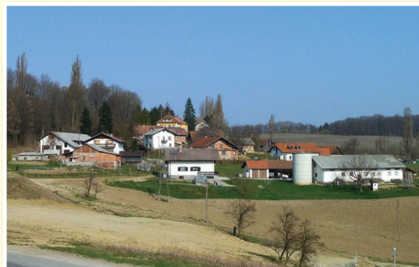
o Sveta Ana: nekatere naložbe v Lokavcu potekajo, nekatere pripravljajo