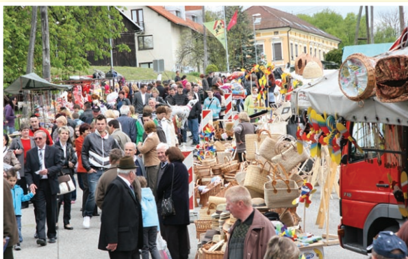
o Praznik občine Sv. Jurij v Slov. goricah – svečano, živahno in množično