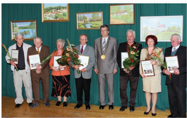
Letošnji nagrajenci občine Sv. Jurij v Slov. goricah