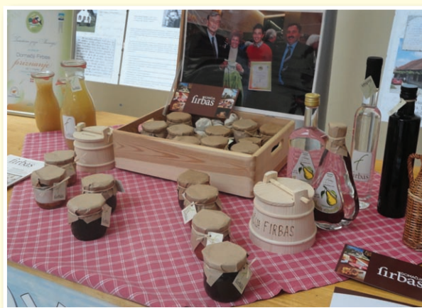
Dobrote Domačije Firbas

V letu 2012 bo društvo nadaljevalo s projekti Ovtarjeva ponudba, Po Goricah, Signa-