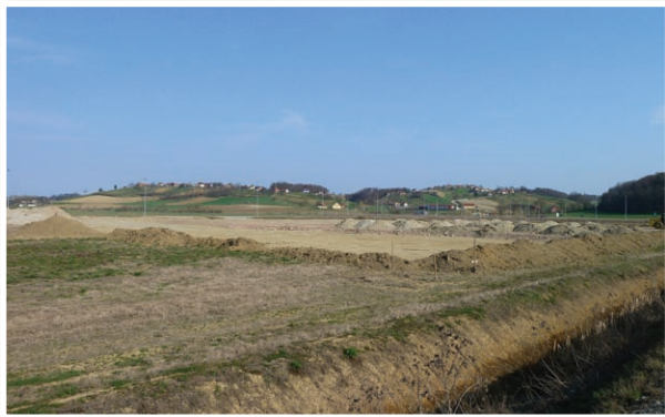
Nova poslovno industrijska cona Lenart čaka na investitorje.

Za spremembo tega zakona so zelo zainteresirani tudi mnogi graditelji v osrednjih Slovenskih goricah, saj je zakon najbolj udaril po žepu investitorje na manj razvitih kmetijskih območjih, kjer so zaradi kakovosti kmetijskih zemljišč odškodnine zelo visoke, čeprav je njihov ekonomski hasek v