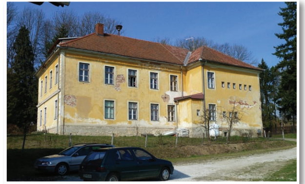
Osnovna šola Lokavec

DIIP za vzdrževalna dela na OŠ Sv. Ana, katerih investicija znaša 253.727 evrov.