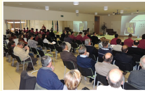
Udeleženci občnega zbora

Ob koncu občnega zbora se je kot primer dobre prakse predstavila Domačija Firbas iz Cogetincev. V okviru akcije Moja dežela, lepa in gostoljubna so prejeli 1. nagrado za turistično kmetijo v kategoriji štirih jabolk.