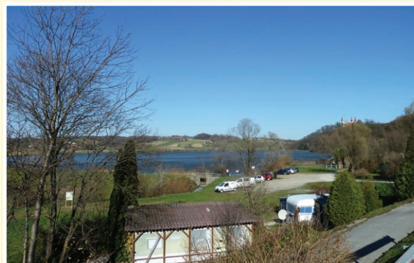
o Gradiško jezero že nosi razpoznavno ime; v Trojico vabi Trojiško jezero