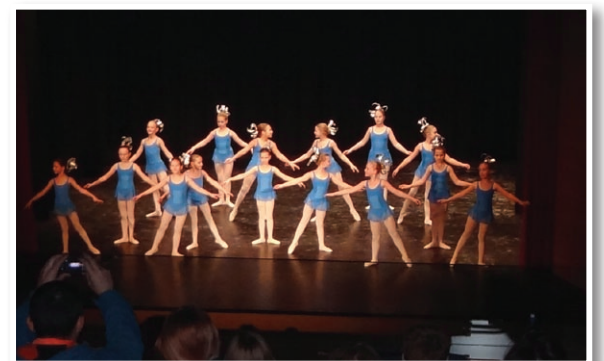
Baletni večer v Kulturnem domu Lenart, prva prireditev v obnovljenem osrednjem prireditvenem prostoru v občini

Uradna otvoritev Kulturnega doma Lenart je predvidena v mesecu juniju 2012.