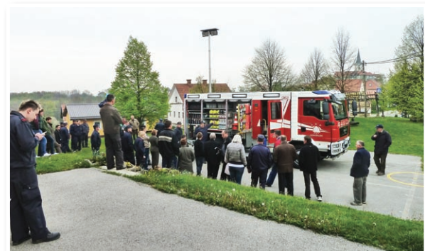
Gasilski avto so pripeljali v Cerkvenjak že 15. aprila

Sicer pa v občini Cerkvenjak deluje 19 društev, klubov in združenj. Njihova aktivnost je tako bogata, da se vsega njihovega