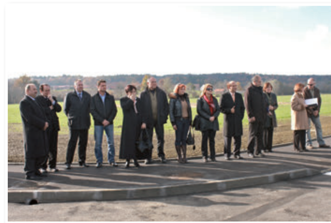
Odprtje Nove poslovno-industrijske cone v Lenartu leta 2009. Razmere so bile takrat za razvoj lenarškega gospodarstva mnogo bolj obetavne ...