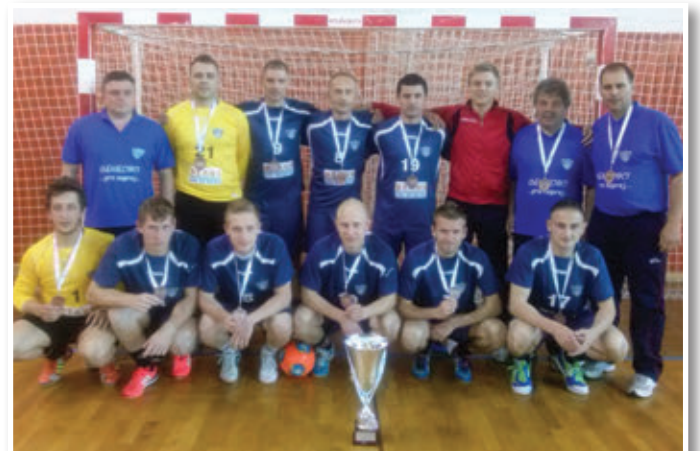
Ekipa Benedikta si je s 3. mestom v 2. SFL priborila 1. Ligo