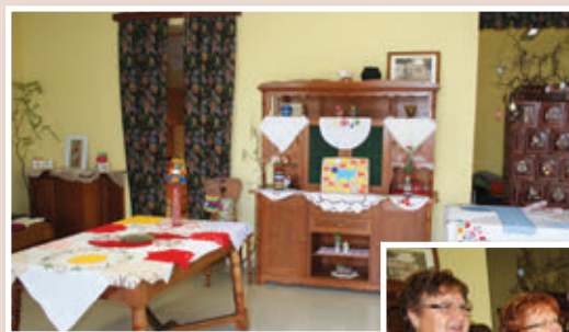
Pripravljeno za otvoritev

Nekaj utrinkov z razstave ročnih del študijske skupine Ročne spretnosti :