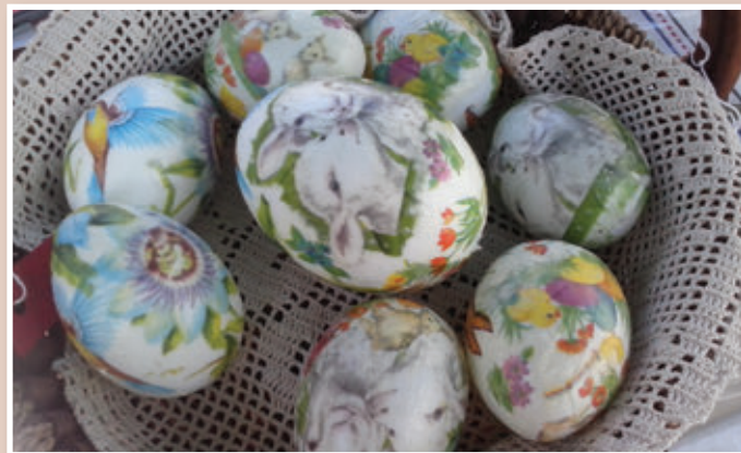
Z letošnjega velikonočnega sejma v Lenartu

Dajmo praznikom polno vsebino. Naj nas izpolnjujejo velikonočna doživetja, ponos na upor in pravica do dela!