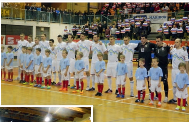
Slovenska futsal reprezentanca z otroki KMN Slovenske gorice

Tekmo je ob 40-letnici delovanja Komisije za mali nogomet (KMN) pri MNZ Maribor organizirala prav