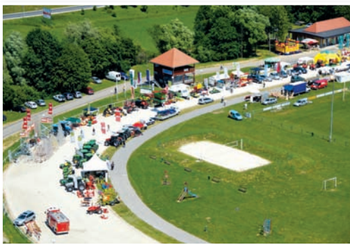
Iz preteklega lenarskega sejemskega dogajanja