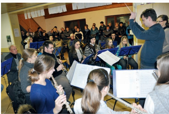
Pevci na vajah s pihalnim orkestrom

22. decembra povabljen k sooblikovanju božičnega koncerta Pihalnega orkestra Apače, ki je del zelo pestrega božičnega repertoarja posvetil skladatelju Verdiju. Pevci so ob sodelovanju otroškega zbora OŠ Apače zapeli Nabucco in navdušili mnogoštevilno občinstvo. Ob spremljavi orkestra so odpeli še nostalgичno Time to say goodbye Andree Bocelija ter še nekaj božičnih pesmi iz svoje