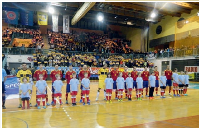
Španska futsal reprezentanca z otroki NK Lenart