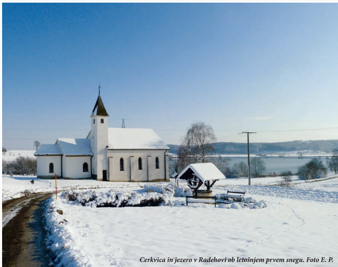
Cerkvica in jezero v Radehovi ob letošnjem prvem snegu.