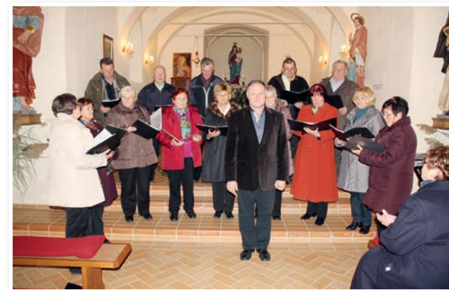
15. let Mešanega pevskega zbora MDI Lenart

popestrili lepo pevsko prireditev. Ker je cerkva akustična, so se nastopajoči predstavili brez ozvočenja. Kot prvi so nastopili gostitelji, to je Mešani Pevski zbor MDI Lenart, ki so zapeli tri pesmi. Sledil je nastop Ljudskih pevke Društva upokoјencev Lenart. Koncert