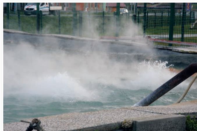
To nista gejzirja, pač vodna curka iz vrtine tople vode v Benediktu