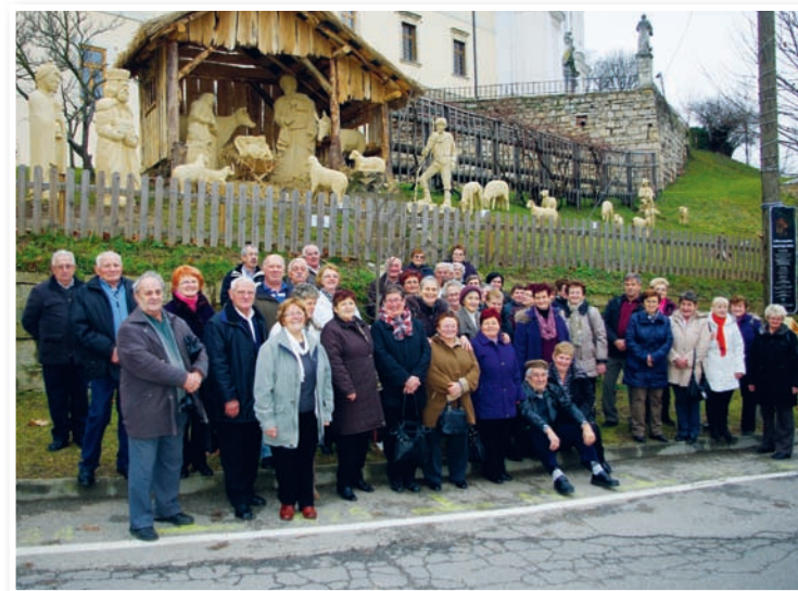
Upokojenci iz DU Mačkovec, foto: Peter Leopold