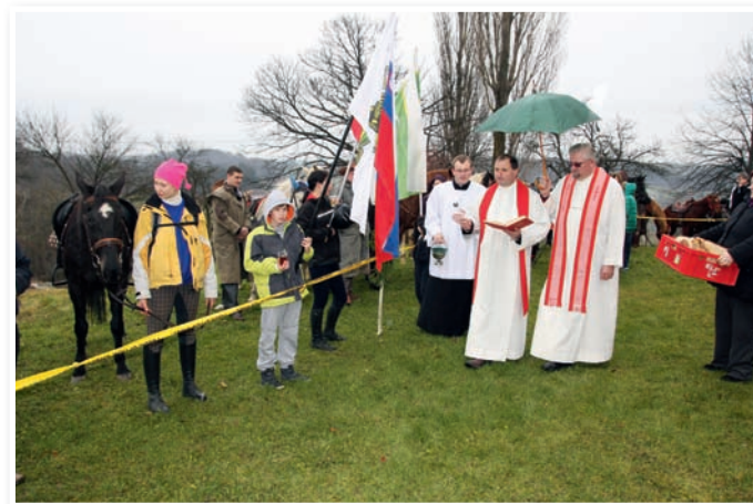
Blagoslov konj pri cerkvi Sv. Treh Kraljev pri Benediktu

Vše ne tako davni preteklosti je bilo na območju občine Benedikt veliko delovnih ali vprežnih konj. Imeli so jih le večji kmetje, ki so s konji obdelovali svoja polja, opravljali pa so usluge maloposestnikom, ki so jim njihovo delo, oranje ali prevoze, odslužili z delom, »tabrhi«. Po drugi vojni, ko so kmetom zaplenili zemljo in ustanovili kmetijske zadruge, ki so 1953. leta propadle, so bili konji pomembna vprežna živina v teh zadrugah, kjer so zanje skrbeli delavci, ki so jim rekli »konjarji«. Danes delovnih konjev ni več, saj njihovo delo opravljajo traktorji. Nekaj časa je bil konj pskoraj