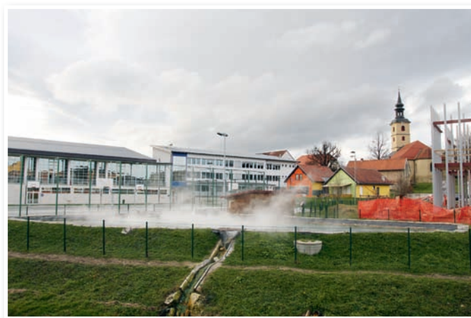
Topla voda iz zemlje greje Benedikt