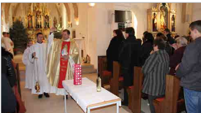
Blagoslov vina v cerkvi sv. Benedikta v Benediktu