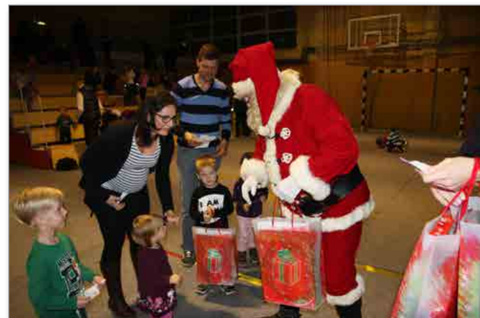
Božiček obdaruje otroke iz občine Sv. Trojica.