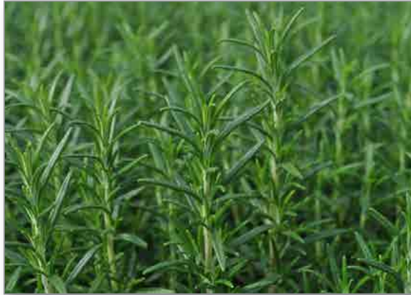
Gre za pridelovanje zimzelenega rožmarina (lat. Rosmarinus officinalis, angl. Rosemary) vrste ARP.

Pri tem je pomembno, da razen priprave zemljišča pred posaditvijo, posaditve in žetve polje ne zahteva večjega obsega dela, sama žetev pa je strojna.