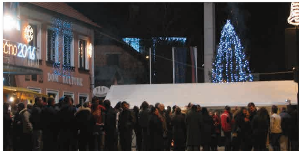
Novo leto so na prostem pričakali tudi v Cerkvjenjaku.