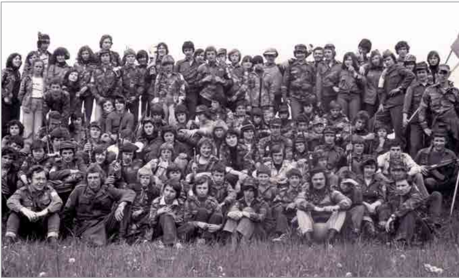
Udeleženci pohoda Po poteh revolucije v občini Lenart