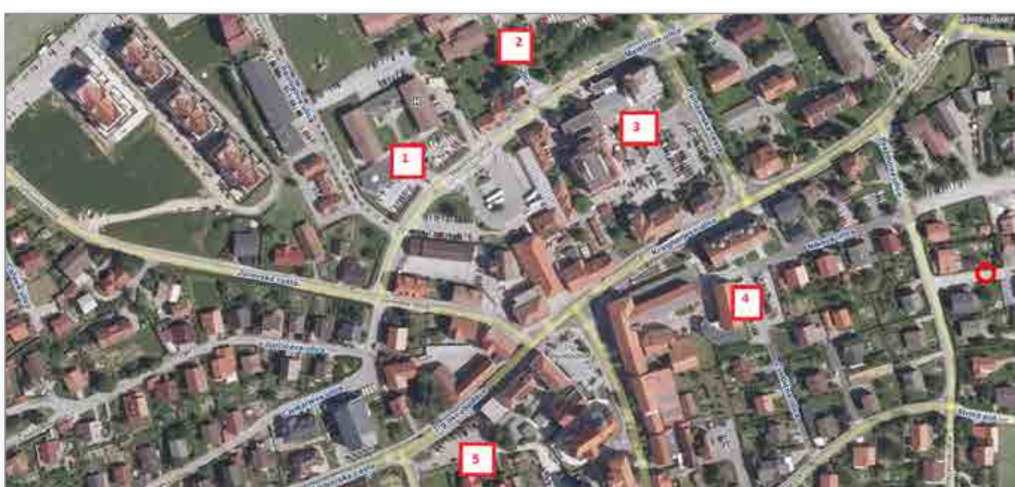
Označena območja časovne omejitve parkiranja