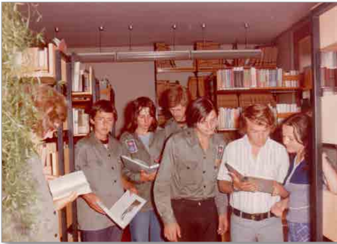
Brigadirji prve lokalne delovne akcije Jurovski Dol '75 med obiskom knjižnice

Začeti pa je treba vedno na začetku, zato vabimo vse, ki ste bili nekoč brigadirji ali pohodniki ali celo oboje hkrati, da se od-