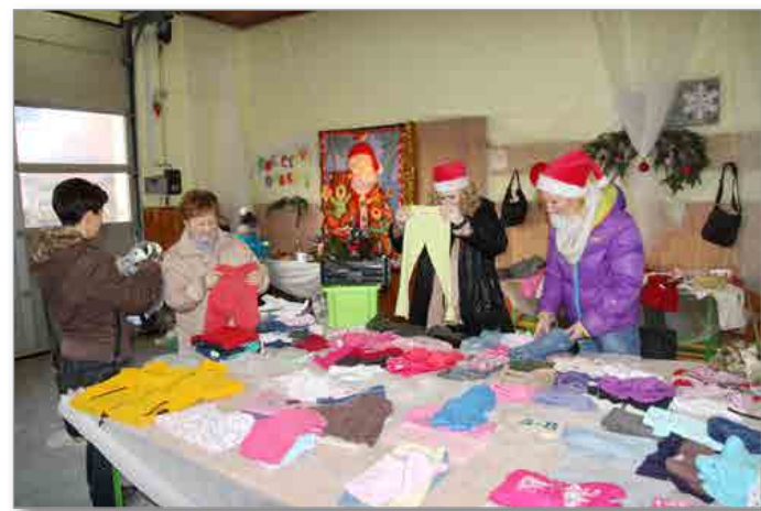
Izmenjava otroških oblačil in drugih otroških reči je uspela.

načrtujeta tudi pripravo »izmenjalnice« za ženska oblačila in modne dodatke, ki se bo odvijala 5. marca 2016. Organizatorici se vsem, ki so darovali oblačila, obutve in igrače, zahvaljujeta. Zahvaljujeta se tudi PGD Sv. Trojica za brezplačno nudenje prostora ter