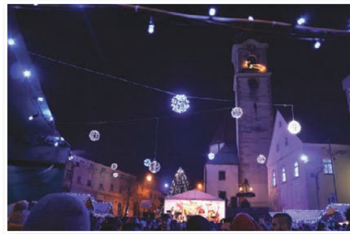
Silvestrovanje, foto: Žiga Strmšek

spel pesmi, neverjetna energija, ritem, predanost glasbi, ubranost, glas kot najlepši instrument, s temi besedami lahko opišemo koncert, ki nas je prevzel. Od Miklavževega pa do Silvestrovega so ob petkih in sobotah na Trgu osvoboditve potekale otroške prireditve, glasbeni nastopi in koncerti, obisk Miklavža in Božička. Praznično vzdušje so