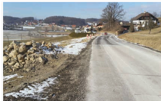
Saniran plaz na državni cesti v Jurovskem Dolu čaka še na fino asfaltno prevleko.

državni cesti, ki poteka skozi občino. Izvajalci se bodo najprej lotili sanacije plazov pri lovskega doma in zaključili sanacijo plazov v Jurovskem Dolu, ki čaka še na fino asfaltno preplastitev. V drugi polovici leta je v načrtu tudi sanacija plazov v Zg. Partinju, ki je tudi