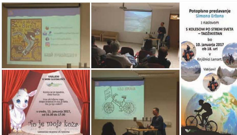
Za začetek se je v januarju zgodilo nekaj stvari za najmlajše in predavanje za odrasle.