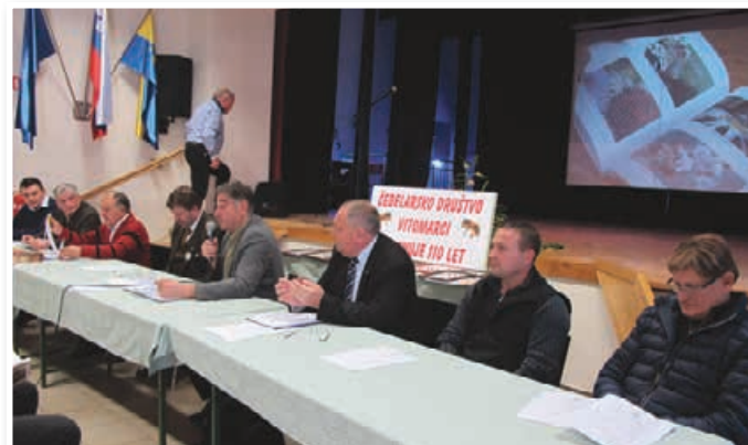
Udeleženci okrogle mize so spregovorili o bogati čebelarji tradiciji v osrednjih Slovenskih goricah.