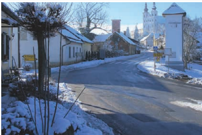
V občini Sveta Trojica so doslej vzorno skrbeli za razvoj, kar se odraža tudi na urejenosti občine in kraja.

Ugodno vreme je tudi omogočalo nadaljevanje del na modernizaciji ceste JP 703 752 Osek-železnica in modernizaciji oseka ceste JP 703753 Osek-Šeruga v skupni dolžini obeh odsekov skoraj 1.500 m. Izvedena je bila glavna del, cesta pa bo lahko v