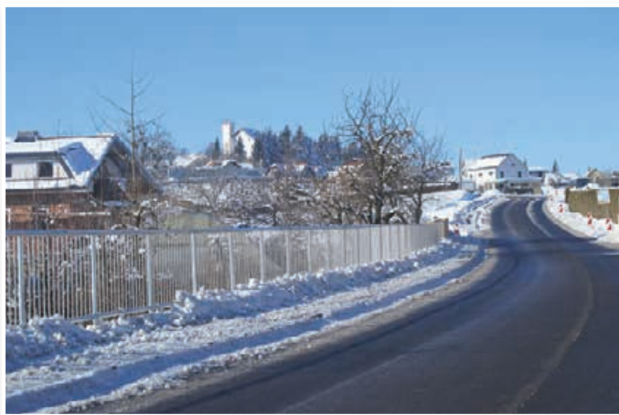
Delavcem podjetja Marko/Mark Nival je uspelo prvi odsek regionalne ceste Cerkevjak-Sveti Jurij ob Ščavnici, ki jo rekonstruirajo, grobo asfaltirati pred zimo in ga tako zaščititi pred polarnim mrazom in vlago.

Občina Cerkevjak bo letos financirala tudi pripravo dokumentacije za energetske sanacije šole, ki jo bodo izvedli v naslednjih letih. Okoli 17 tisoč evrov pa bodo namenili za nakup novega kombi vozila za potrebe gasilcev. Okoli 5 tisoč evrov bo občina prispevala za obnovo strehe župnišča, poleg tega pa bo izvedla še več manjših investicij.