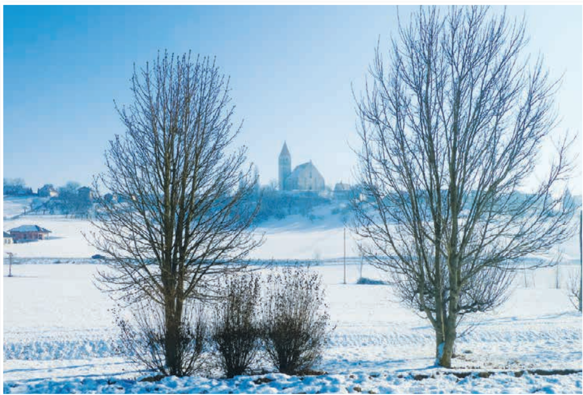
Cerkev sv. Treh kraljev pri Benediktu na 305 metrov visokem griču, najpomembnejša stvaritev slovenskogoriške gotike iz 16. stoletja, konec januarja 2017.