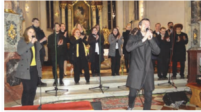
Bee Geesus