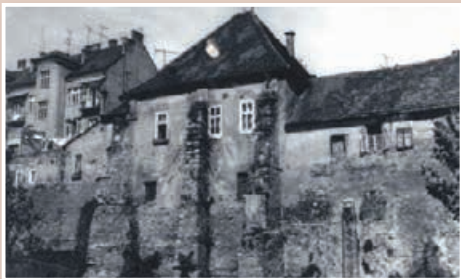
Sinagoga Maribor pred obnovo

Do konca oktobra 1944 je bil holokavst v Sloveniji izpeljan tako, da je bilo uničenih skupno okoli 90 % slovenskih Judov. Po zadnjih podatkih je holokavst terjal 589 življenj, a številka še vedno ni dokončna. V kulturnem in zgodovinskem smislu sta bili trajno uničeni obe prekmurski in goriška judovska skupnost. Konec je bil tudi z Judi v Ljubljani, na Ptujju, v Mariboru in Trstu. Judovska skupnost na Slovenskem si po tej tragediji vse do danes ni opomogla in je postala najmanjša tovrstna skupnost v Evropi. Preživele žrtve holokavsta (izmed slovenskih Judov jih je bilo po vojni le nekaj deset, danes pa jih lahko preštejemo na prste ene roke) zaznamuje vseživljenska travma, zaradi katere mnogi o svoji izkušnji sploh nikoli niso bili pripravljene govoriti. Travma preživelih holokavsta je specifična zato, ker izkušnje razosebljena, preganjanja in brutalnega morjenja ljudi zgolj zato, ker je posamezniku pripisana biološka in kulturna drugačnost, niso vezane na nikakršno