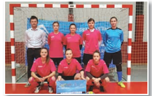
Dekleta Slovenskih goric med 4 v Zagrebu

Nogometašice Slovenskih goric so se z zmago v ¼ finalu nad Beograjkankami (1:0) uvrstile med najboljše 4 ekipe mednarodnega ženskega futsal turnirja, ki je v hrvaški prestolnici potekal od 17. 12. 2016 do 15. 1. 2017. Žal sem jim je po začetnem vodstvu v polfinalnem obračunu proti kasnejšim zmagovalkam, zagrebški ekipi MC plus, finale za las izmuznil (1:2). Po porazu v tekmi za 3. mesto so igralke Slovenskih goric na koncu osvojile odlično 4. mesto med 15 timi ekipami.