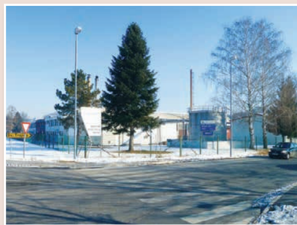
Lentherm konec januarja 2017: objekti samevajo, o prihodnosti ta čas ni nič znanega ...