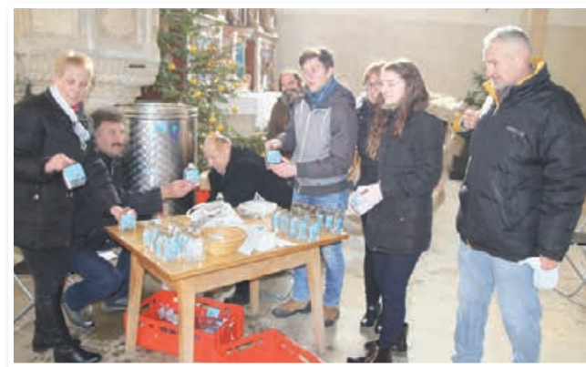
Delitev blagoslovljene trikraljevske vode

vsako leto, letos že devetič, napisan ljudski rek o sv. Treh kraljih. Tokrat: »Če na Tri kralje na jasnem sonce vzhaja, hlapec vriska,