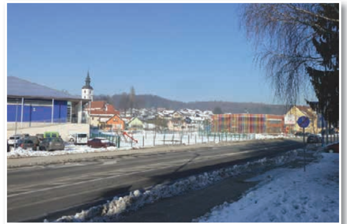
Tako kot v domala vseh občinah v Sloveniji imajo tudi v občini Benedikt zaradi (pre)nizke povprečnine na voljo vse manj sredstev za investicije. Na srečo so najnujnejše investicije, med katere sodi tudi izgradnja novega vrtca, v minulih letih že izvedli.

Gumzar opozarja, da bodo podeželske občine v obdobju 2014–2020 težko črpala tudi razvojna sredstva iz Evropske unije, saj bo evropska unija v novi finančni perspektivi sofinancirala samo projekte, ki spodbujajo socialno kohezijo, enake možnosti in zaposlovanje, vlaganj v komunalno infrastrukturo pa ne. Ker pri nas v podeželskih občinah prebivalci še vedno najbolj potrebujejo komunalno infrastrukturo, si mnoge podeželske občine ne bodo mogle privoščiti vlaganj v projekte za socialno kohezijo, saj bi morala zanje zagotoviti