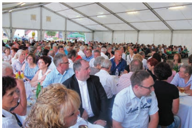
Tako kot vsako leto je bil tudi letos na Županovem večeru prireditveni šotor v središču Benedikta poln do zadnjega kotička.