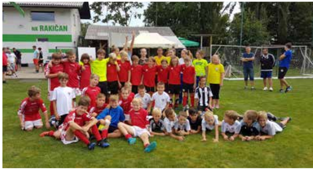
Najboljše 4 ekipe na turnirju do 11 let v Rakičanu