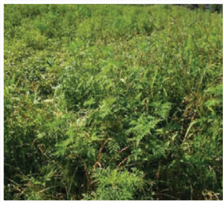
Močno zapleveljena njiva z ambrozijo

Več težav in dela je z rastlinami, ki so ob njihovih robovih že v predelu njiv, kjer se zaradi dobre založenosti tal s hranili ter manjše konkurence s strani gojenih rastlin ter drugih plevelov v zadnjem času rastline ambrozije zelo uspešno razvijajo. Že v začetku poletja lahko dosežejo 1 m ali več, zaradi česar jih s selektivnimi herbicidi ne moremo več uspešno uničiti, med gojenimi rastlinami pa jih praviloma