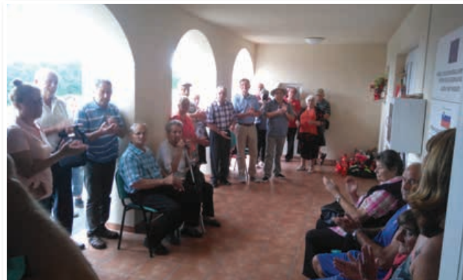
Slovesnost v spomin na tragično usodo družine Druzovič.