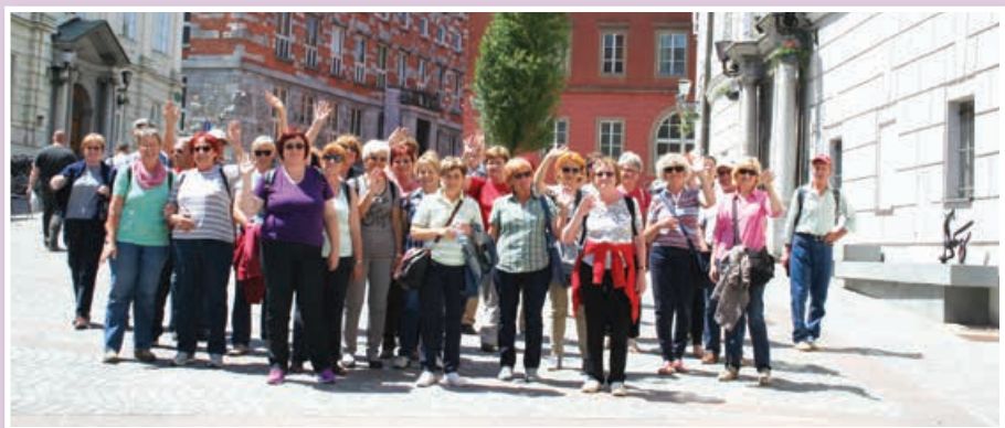
Strokovna ekskurzija – ogled Ljubljane