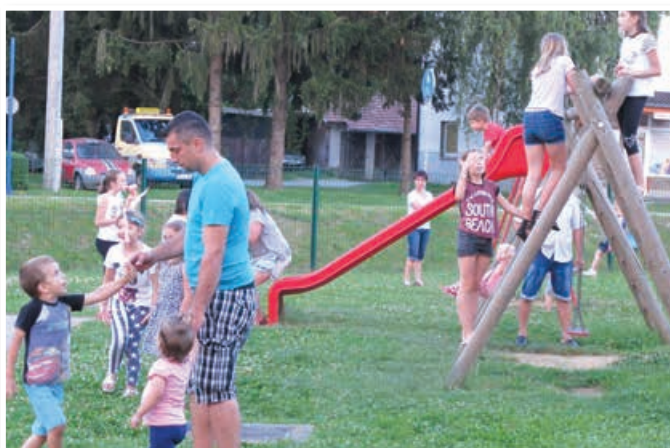
Najbolj spodbuden je bil pogled na množico otrok in mladine pred prireditvenim prostorom, ki predstavlja perspektivo občine Benedikt.