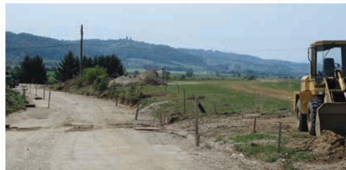
»Glavna cesta« skozi na novo nastajajoče naselje Trojica jug je že gramozirana.