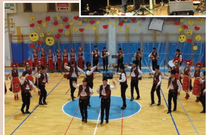
Polgarski Folklorni ansambel Trakija iz Plovdiva