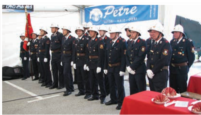
Častni vod GZ Lenart