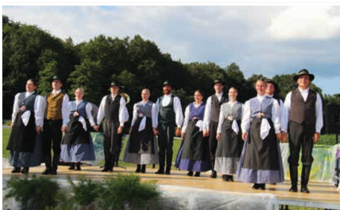
Nastop folklornih skupin