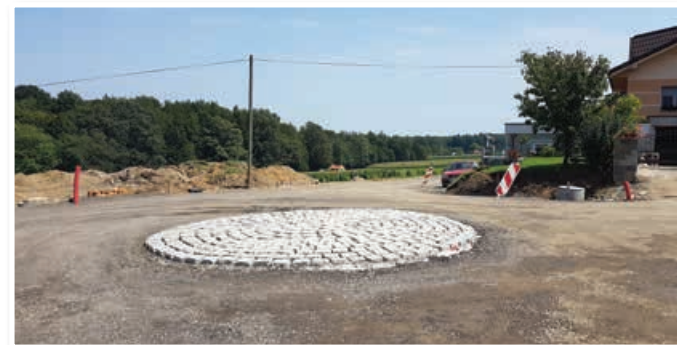
Krožišče v Sp. Gasteraju