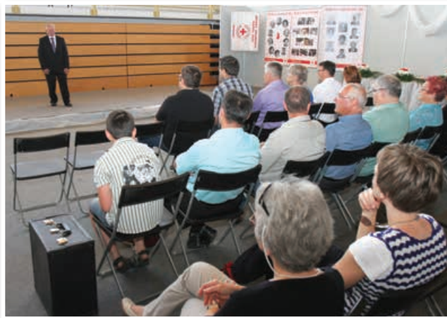
Otvoritev razstave Humanost in kultura