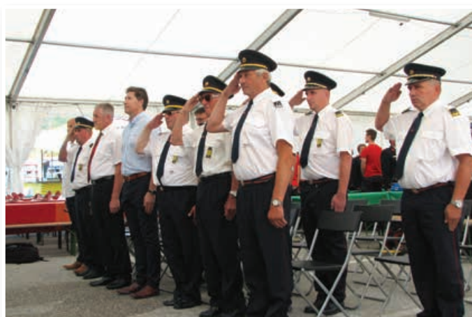
Gostje benediške gasilske jubilejne slovesnosti

domu obnovili fasado, menjali vsa tri garažna vrata in postorili še veliko drugega.