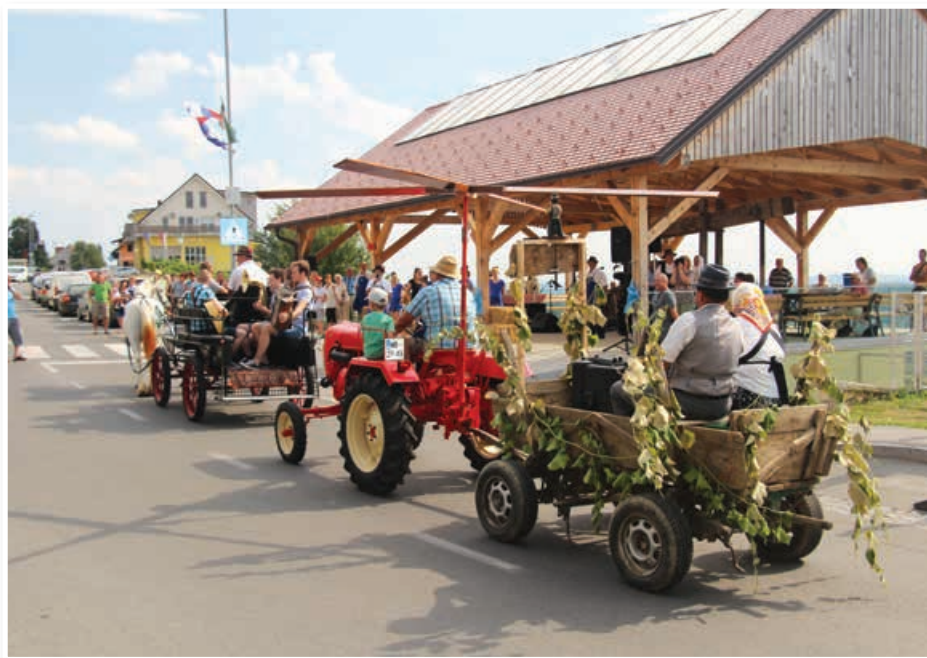
Anin teden 2017, s katerim so praznovali 19. praznik Občine Sveta Ana, se je raztegnil od 11. do 26. julija. V njem se je zvrstilo več prireditev, ki potekajo tudi v okviru širokih evropskih medregionalnih projektov. Med njimi 22. julija prireditev o klopotcu in s postavitvijo tega ne zgolj vinogradniškega simbola.