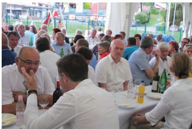
Osrednje slovesnosti ob občinskem prazniku občine Benedikt so se udeležili tudi župani občin iz osrednjih Slovenskih goric in drugi gosti.