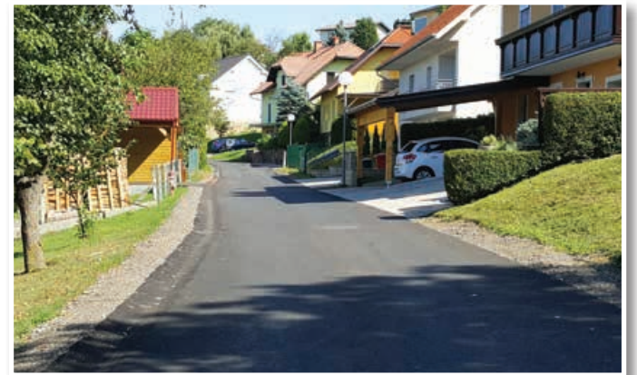
Ulica pod bregom

znana končna vrednost investicije, ki je sedaj okvirno sicer ocenjena na preko 2 mio EUR, pri čemer je delež občine približno 47 % te vrednosti.