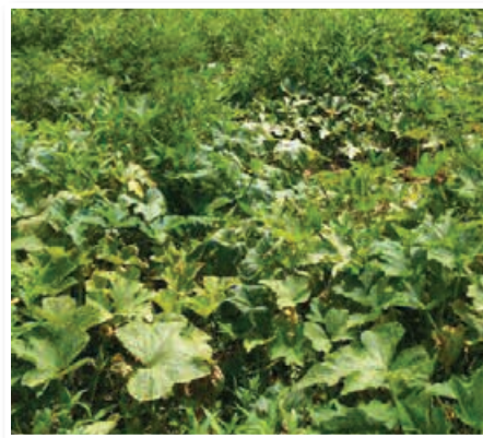
Pojav širitve ambrozije v notranjost posevka oljnih buč

nevarna in trdovratna zadeva, tako za okolje in ljudi, zato moramo zelo hitro ukrepati in odstraniti vse rastline.