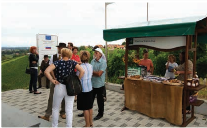
60-letnica Čebelarstva društva sv. Ana