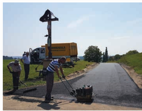
Asfaltiranje ceste v Sp. Gasteraju

Kljub poletnim počitnicam in vročinskimi valovom, ki so udrhali po Sloveniji, dela na Gasterajski cesti niso počivala. Delavci podjetja Komunala Slovenske gorice so v tem mesecu z asfaltiranjem krožišča v Sp. Gasteraju opravili z večjimi deli na tej cesti. V teh dneh sledi še ureditev prometne signalizacije in urejanje priključkov ob cestišču. Sočasno s to rekonstrukcijo je juravska občina asfaltirala še makadamski odsek v dolžini cca 300 m v Sp. Gasteraju.