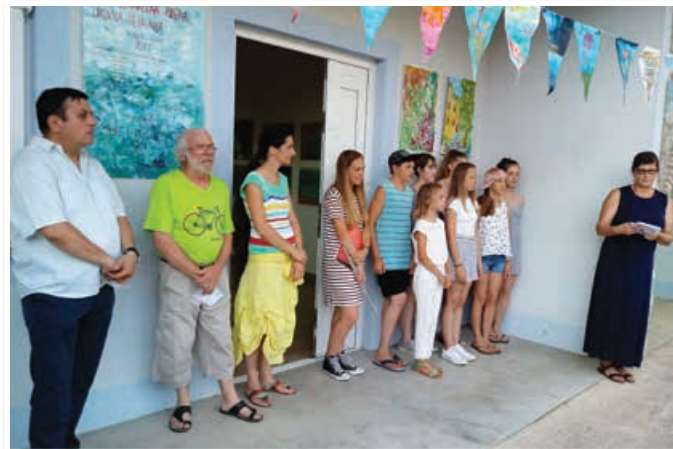
Zaključna razstava v kulturnem domu Županje

»Slike iz moje duše in srca«. V koloniji je sodelovalo 9 mladih iz Občine Lenart, Sveti Jurij in okolice.