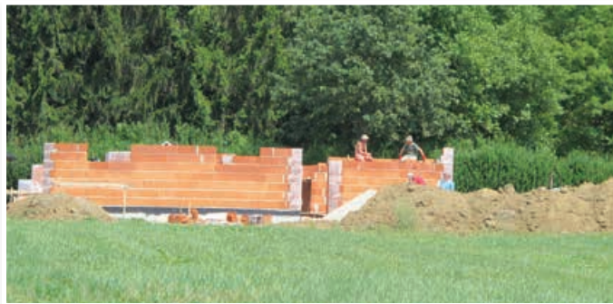
V novem naselju Trojica jug, ki sodi v naselje Sveta Trojica, že gradijo prvo stanovanjsko hišo.

cest v naselju (njihova skupna površina bo znašala 3480 kvadratnih metrov), izgradnjo 755 metrov meteorne kanalizacije in zadrževalnega bazena za meteorne vode, izgradnjo 480 metrov fekalne kanalizacije, izgradnjo 634 metrov vodovoda, izgradnjo javne razsvetljave v dolžini 520 metrov s triindvajsetimi svetilkami ter gradbeno dela za telekomunikacijsko omrežje. Projektno dokumentacijo je izdelalo podjetje Progrin, varnostni načrt pa podjetje Finesa iz Močne pri Pernici. Vsa dela naj bi izvedli do marca 2019.