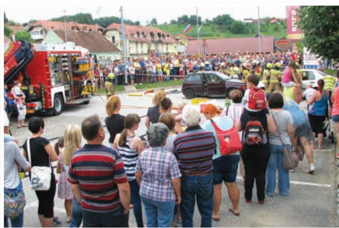
Gasilska vaja Benedikt 2017 je privabila množico gledalcev.