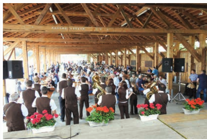
Pogled na dogajanje na prireditvenem prostoru ŠRC Polena v času proslave

skozi 60 let. Posebej se je zahvalil predhodnim in današnji generaciji ribičev za neutrudno delo pri varstvu voda, življa v njih ter ohranjanju naravnih danosti okolja, v katerem delujejo. Prizadevanja ribičev žal niso vedno naletela na posluš in zato se danes marsikje soočamo s slabim stanjem vodotokov, predvsem reke Pesnice, ki je bila nekoč neprimerno bogatejša z ribami kot danes, ko je potrebno za ohranitev kolikor toliko sprejemljivega staleža rib te redno vlagati. Izpostavil je dobro sodelovanje z občinama Lenart in Sveta Trojica.