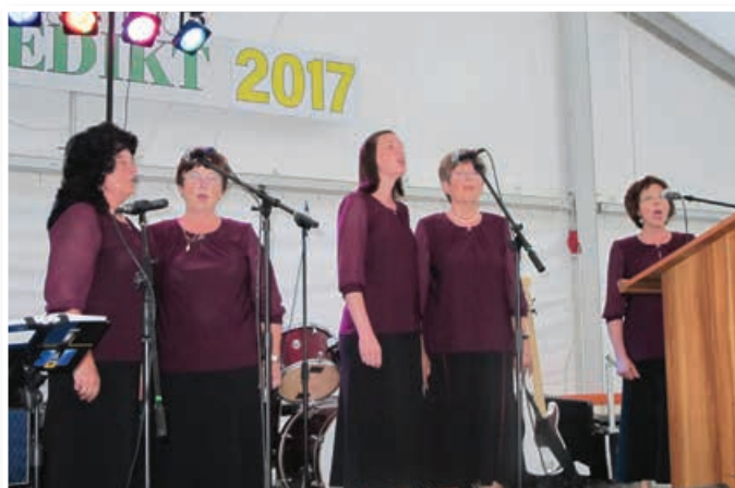
V kulturnem programu je sodelovala pevka skupina Žitni klas.