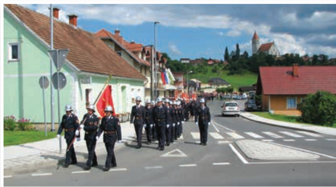
Povorka gasilcev in gasilskih vozil je bila zgledno zastopana.

sodelovalo vseh deset gasilskih društev GZ Lenart, PGD Maribor-mesto, PGD Kamniška Bistrica, PGD Gornja Radgona, Slovenska vojska s helikopterjem za gašenje požarov, Policija in Zdravstveni dom Lenart. Vajo, kakršne nismo videli že dolgo, tudi v širšem slovenskem prostoru ne, si je ogledalo okrog tisoč obiskovalcev, ki so bili nad njo navdušeni. Vaja je potekala na šestih točkah in je prikazala tehnično reševanje, izvajanje notranjega in zunanega napada, reševanje iz višine, reševanje preko spustnice, prikaz gašenja osebne vozila, nudenje prve pomoči in prikaz gašenja s helikopterjem. Po vaji so opravili analizo izvedbe vaje in jo pozitivno ocenili. Vodil jo je poveljnik domačih