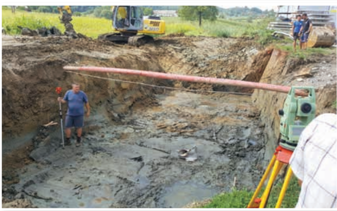
Most Voličina – Ruperški potok

V Sp. Voličini, pri športnem igrišču, je v teku obnova mosta, ki bo končana do konca avgusta. Sočasno s gradbenimi deli na mostu bo izvedeno tudi asfaltiranje ceste od mosta do pošte. Velik zalogaj je tudi sanacija plazu v Sp. Voličini, pod Jazbinami, ki še ni zaključena.