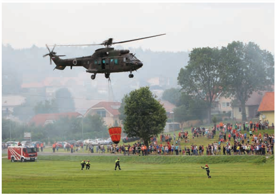
Uvodni dogodek 18. praznika Občine Benedikt je bila v petek, 30. junija, gasilska vaja na Čolnikovem trgu, Slatinski cesti in ob Vinogradniški poti. Organizatorji so pripravili eno največjih in najatraktivnejših gasilskih vaj v tem delu Slovenije sploh. Praznovanje so končali v nedeljo, 9. julija, s sveto mašo v počastitev farnega patrona svetega Benedikta.