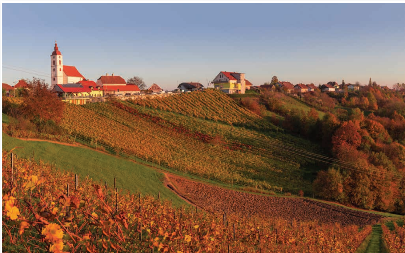
Sveta Ana se je odela v jesenske barve ...