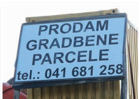
Zanimanje za gradbene parcele v novem naselju je vse večje.

videti, kako na travniku raste novo naselje, v katerem bo 60 hiš.