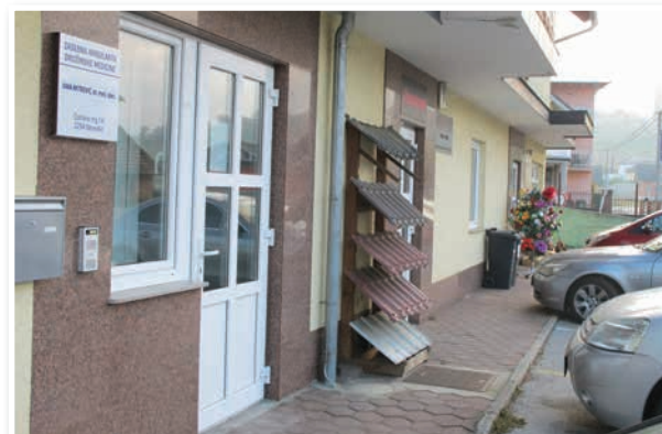
Zdravstvena ambulanta v Benediktu