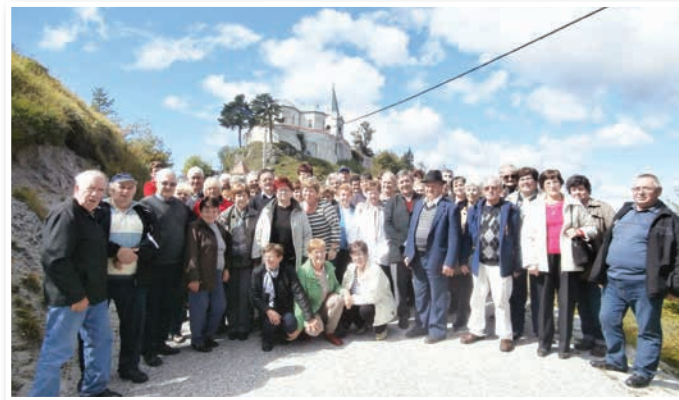
Na Sveti gori v Zasavju