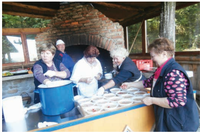
Druženje na kmetiji Postružnik

Društvo upokojencev Sv. Trojica v Slov. gor. je že prek deset let povezano v obliki pobratenja, prijateljstva in različnega sodelovanja z DU Rogoznica pri Ptujju, nekaj let manj pa z DU Mačkovci v Prekmurju. Pred nedavnim (28. avgusta) izvršenim druženjem z DU Mačkovci v Mačkovcih je 28. septembra 2017 potekalo druženje med tema društvoma na turistični kmetiji Postružnik v Zg. Porčiču. Ob obilnem delu in zavzetosti članov domačega društva ter prispevkov v obliki sladice in srečelova je druženje zelo dobro uspelo. Gostom iz Prekmurja je bila zelo všeč lokacija pri Postružnikovih.