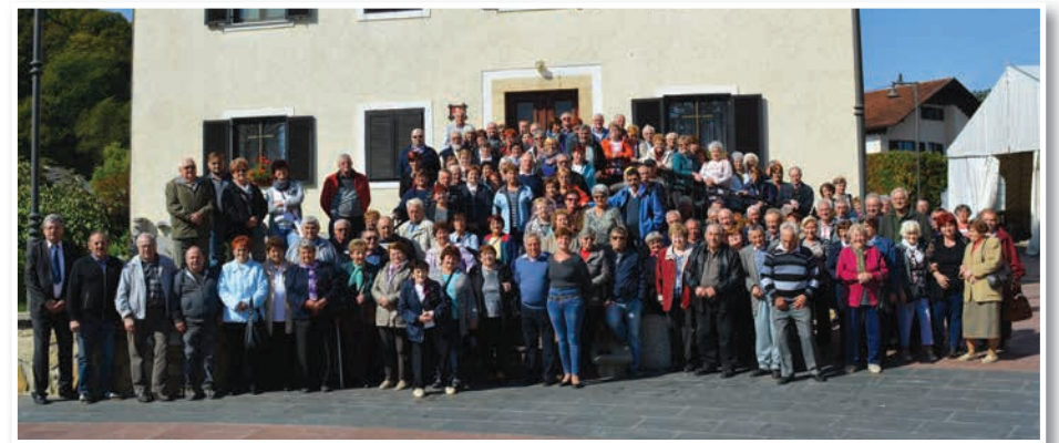
Srečanje je poteklo ob domači hrani, dobri kapljici in prijetni glasbi.