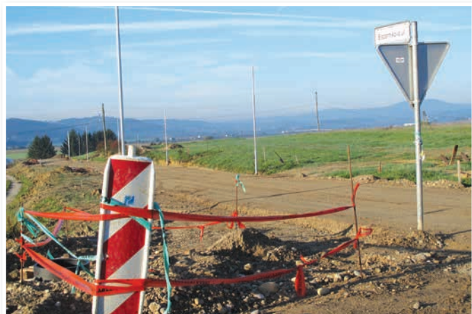
Ulica Rajka Slapernika v nastajajočem naselju Trojica Jug je že zgrajena. Po njej je brez problemov možen dostop do gradbenih parcel z avtomobili, tovornjaki in gradbeno mehanizacijo.