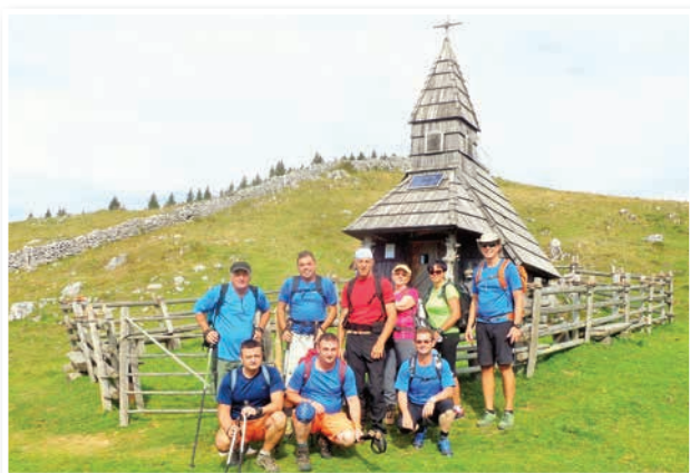
Start na Biba planini (1308 m)