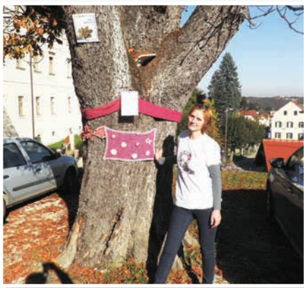
Rožnate pletenine 17. oktobra v Sv. Trojici

V zadnjih dneh je precej zanimanja in vprašanj vzbudil v rožnate pletenine oviti divji kostanj, ki stoji ob OŠ in vrtcu, ob poti v trško jedro in k znameniti cerkvi in samostanu Sv. Trojica. Brez skrbi, drevo se ni »prehladilo«, pač pa je tudi Občina Sveta Trojica v Slovenskih goricah vključena v akcijo Rožnate pletenine.