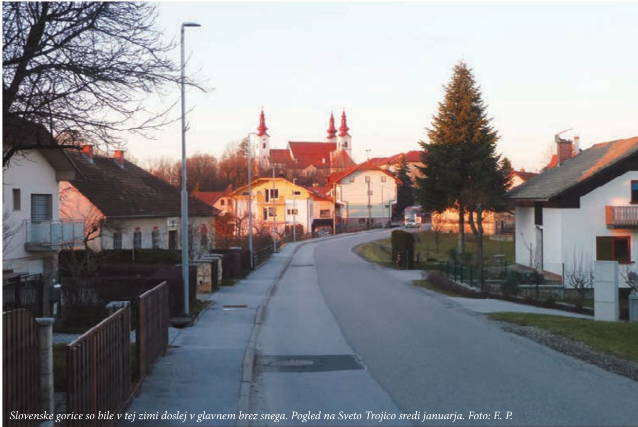
Slovenske gorice so bile v tej zimi doslej v glavnem brez snega. Pogled na Sveto Trojico sredi januarja.