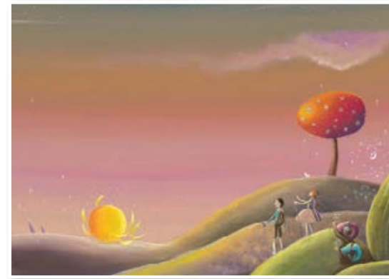
Ilustratorka Mojca Fo je risala Katko in polžka na lesene plošče, naredila jih je žive v tem širnem svetu, polnem presenečenj in krutega.