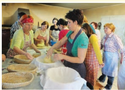
Delavnica Peka kruha