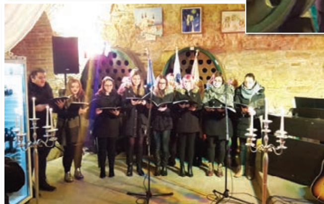
Vokalna skupina Vox Angelica