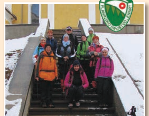
Gora Oljka - zaključni pohod v letu 2017