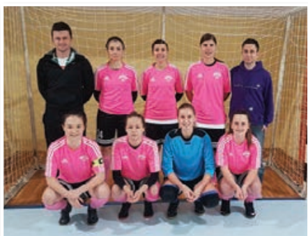
KMN Slovenske gorice

Lestvica po 7. krogu: 1. KMN Slovenske gorice (19) , 2. ŽNK Celje (14), 3. Siliko Nova panorama (4), 4. ŽNK Cerkevjenjak (2).