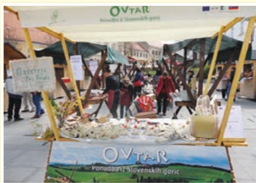
Velikonočni sejem 2012