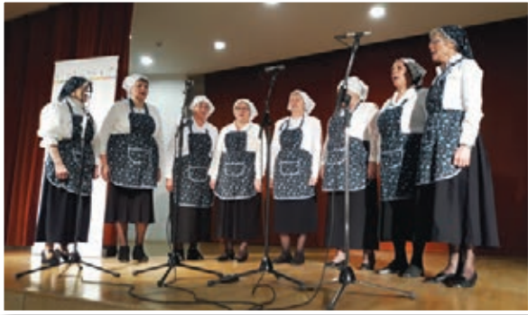
Nastop ljudskih pevck KD Sveta Ana