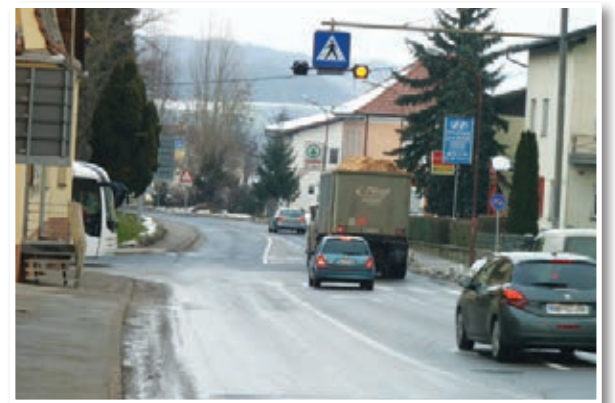
Krožišče bo tudi ob stari lekarni ...