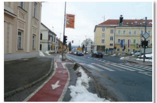
Na osrednjem križišču bo krožišče