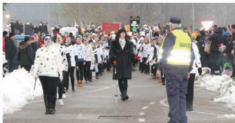
Lenarske mažoretke so se za pusta prelevile v krotke dalmatince.