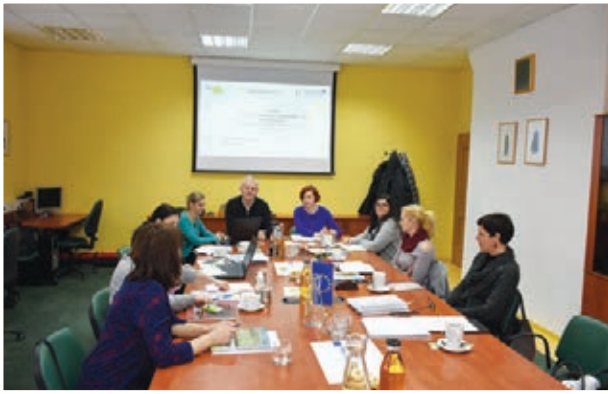
Udeleženci 3. koordinacijskega sestanka Escape 7. 2. 2018