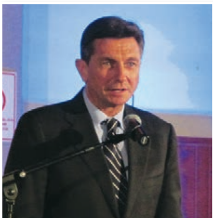
Borut Pahor: Potrebujemo eden drugega, pa ne samo v času krize.