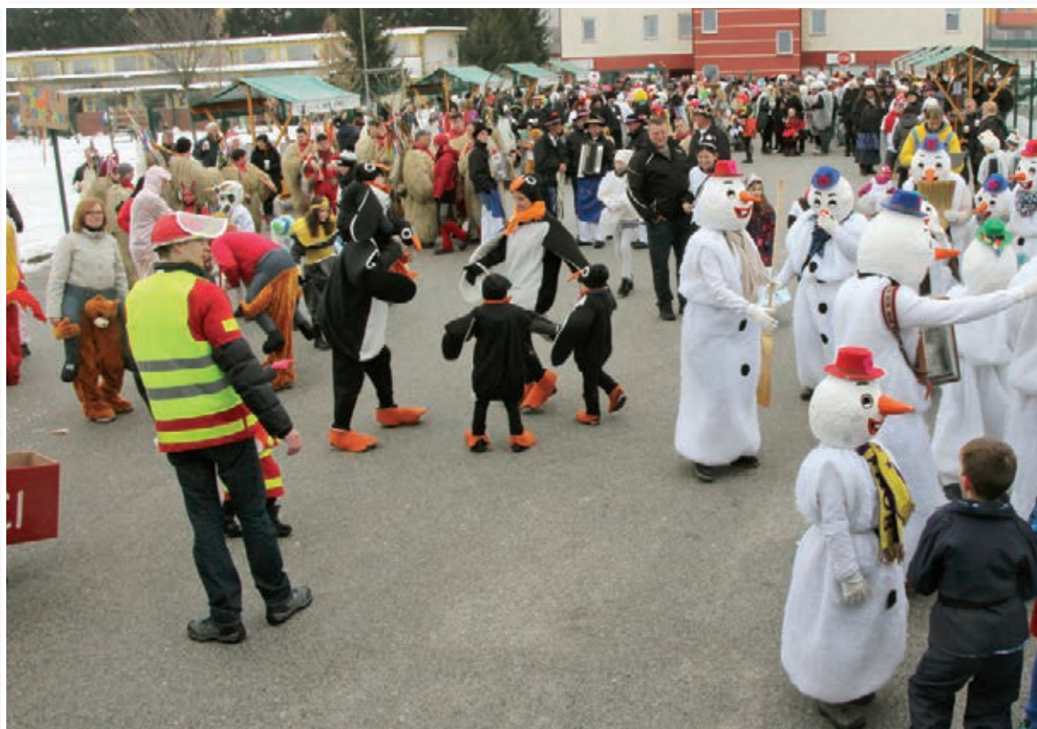
Pri Lenartu so pripravili že 27. pustno povorko, v kateri je sodelovalo okrog 1400 maškar iz domače in drugih občin. Njihov pohod je navdušeno spremljala množica obiskovalcev (str. 12).