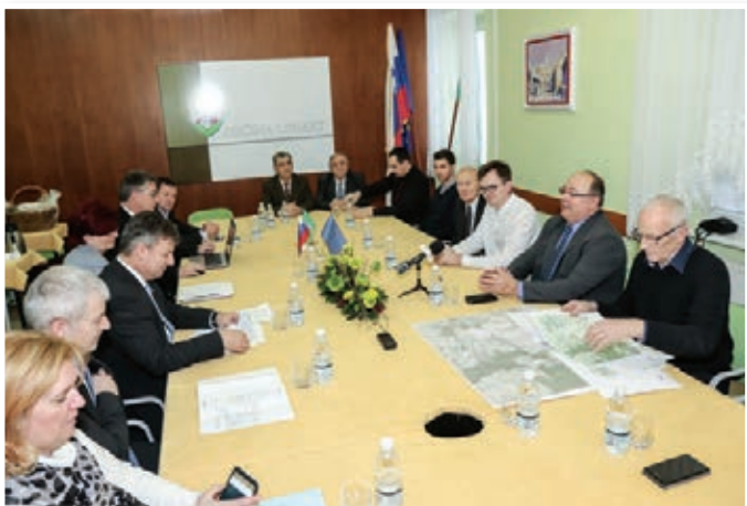
Pogovor v občinski sejni sobi