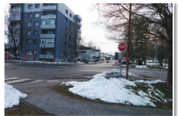
... in pri avtobusni postaji.