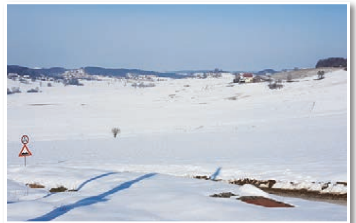
Sicer idilična zima načenja občinski proračun.