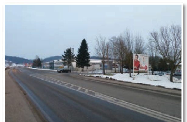
Na odcepu za Sv. Trojico bo poslej krožišče.