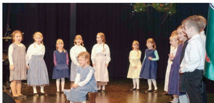
Po vseh osrednjih Slovenskih goricah so ob slovenskem kulturnem prazniku pripravili proslave (str. 8). Utrinek z lenarske.