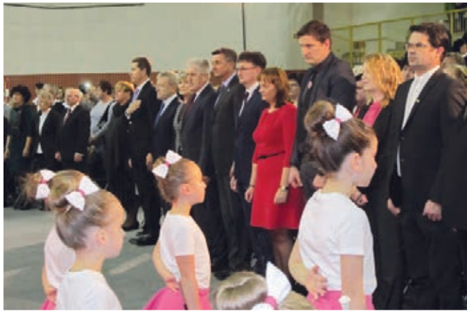
Proslave ob 70-letnici OO RK Benedikt se je udeležil tudi njen častni pokrovitelj, predsednik republike Borut Pahor.