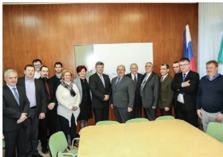
Lenart je sredi februarja obiskala ekipa ministrstva za infrastrukturo. Občini očitno uspeva pravi preboj na področju cestne infrastrukture (str. 5).