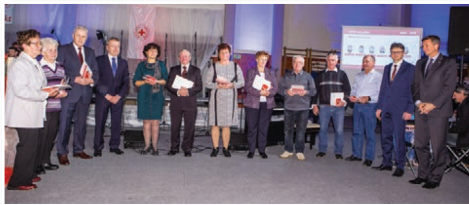
Nekdanjim predsednikom OO RK Benedikt in krvodajalcem, ki so kri darovali več kot 70-krat, je čestital tudi predsednik republike.

Članicam in članom Rdečega križa v Benediktu se je za njihovo prostovoljno humanitarno delo zahvalil tudi predsednik Rdečega križa Slovenije dr. Dušan Keber. Poudaril je,