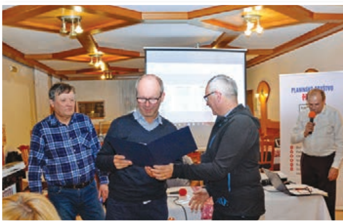
Podelitev priznanj članom