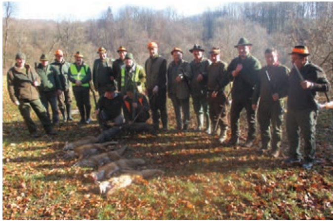
Pozdrav lovini – simbolično slovo divjadi od lovišča

lovih na lisice v mesecu januarju, ko so ostali lovni končani.