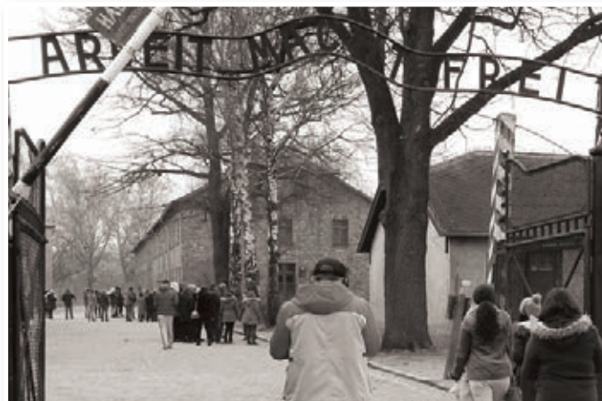
Taborišče Auschwitz-Birkenau vedno znova pretresa obiskovalce.

S edemindvajseti januar je v svetu od 2006 naprej obeležen kot svetovni dan spomina na žrtve holokavsta. Na ta dan leta 1945 je namreč ruska rdeča armada osvobodila največje nacistično koncentracijsko taborišče Auschwitz-Birkenau.