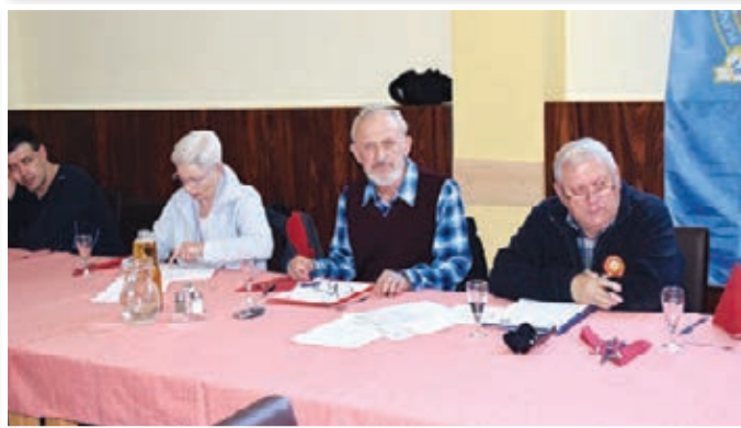
Zbor vodnikov in zbor markacistov, foto: Laslo Ligeti in Drago Lipič

zo Slovenije (PZS) vključenih 290 planinskih društev in raznih klubov, ki se vsebinsko navezujejo na planinsko vsebino dela. Po podatkih PZS je članstvo v 2017 preseglo številko 57.000, kar PZS uvršča v sam vrh med Zvezami v Sloveniji.