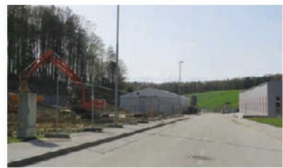
Občina Cerkevjak je v zadnjem času prodala kar tri parcele v Poslovno-obrtni coni v Bengovi, na katerih so nekateri investitorji že začeli graditi gospodarske objekte.