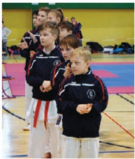
Lenarški karateisti ob otvoritvi tekmovanja