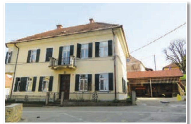
Občina Sveta Trojica bo zahvaljujoč rebalansu proračuna izvedla več novih projektov oziroma investicij. Med njimi bo tudi energetska prenova poslovne stavbe na Trojiškem trgu.

Za načrt gradnje odprtega širokopasovnega omrežja v občini Sveta Trojica bo občina dala nekaj več kot 8,5 tisoč evrov, za proračun najemine za infrastrukturo vodooskrbe pa preko 10,5 tisoč evrov. Za rekonstrukcijo tranzitnih cevovodov na relaciji Košaki-Počehova, ki jo