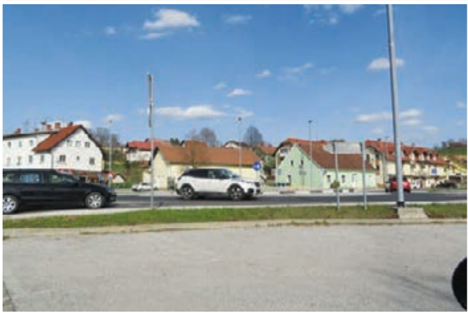
Število prometnih nesreč v občini Benedikt se je lani glede na leto poprej precej zmanjšalo.

Podobne trende so policisti lani zabeležili tudi na območju občine Benedikt. Lani so na območju te občine obravnavali kar 46 kaznivih dejanj, leto poprej pa 18. Tudi njihova raziskanost se je nekoliko poslabšala. Med kaznivimi dejanji so prevladovala kazniva dejanja zoper premoženje. Takšnih je bilo lani 28, predlani pa 10. Največ je bilo tatvin in velikih tatvin oziroma vlomov.