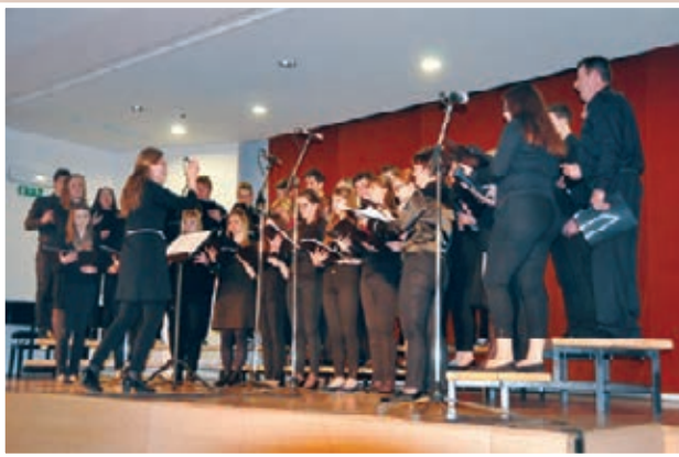
Cerkveno prosvetni mešani pevski zbor KD Sveta Ana