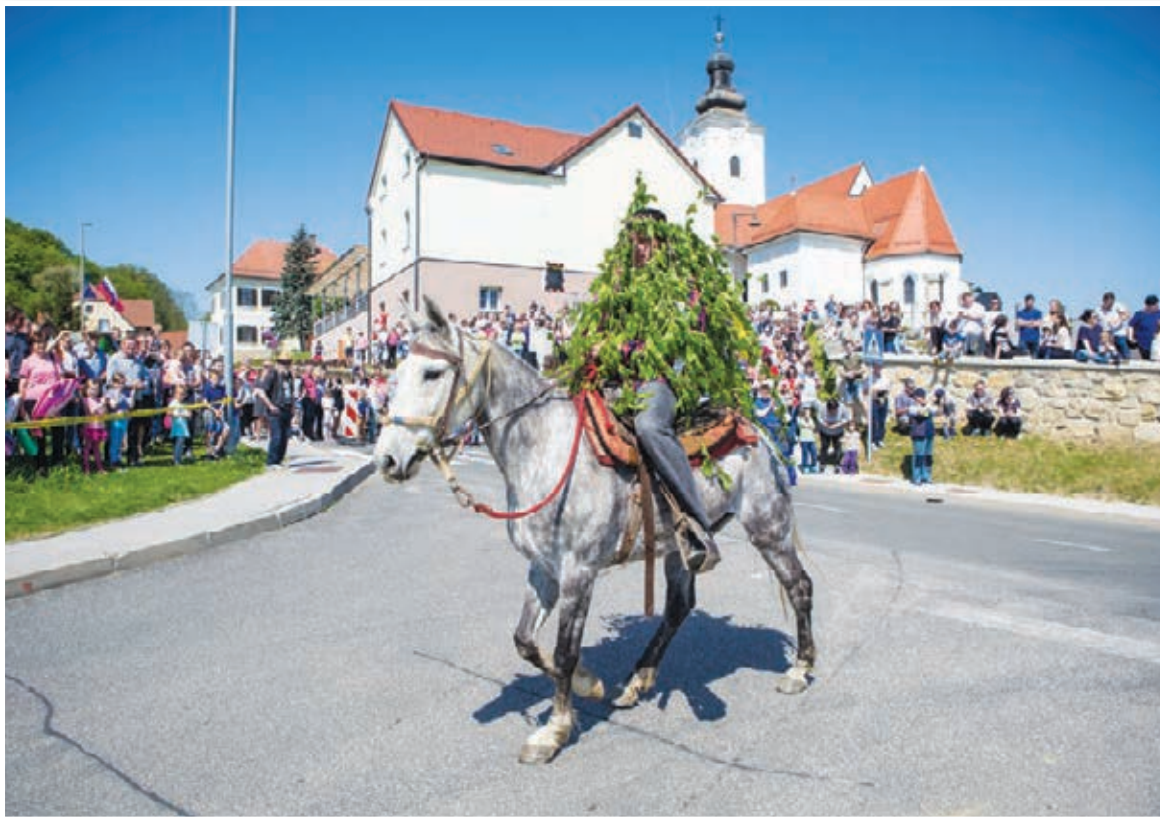
Tradicionalno jurjevanje na Jurjevo nedeljo ob prazniku občine Sv. Jurij v Slov. goricah je pritegnilo v Jurovski Dol okrog 2000 obiskovalcev, med njimi k blagoslovu konj več kot 70 konjenikov iz domače in drugih občin.