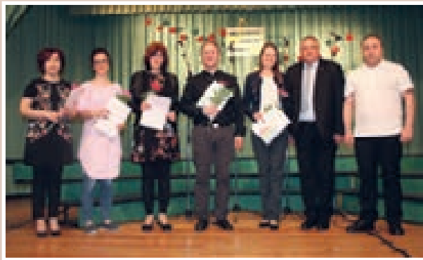
Na fotografiji (arhiv sklada) so zborovodkinje in zborovodja nastopajočih zborov (manjka zborovodkinja cerkvjenjakega pevškega zbora) z županom in predsednikom Sveta JSKD Lenart.