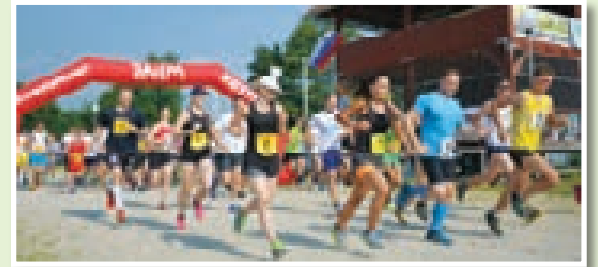
Lanski štart ...

najmlajše na razdaljah 200, 400 in 1000 m. Predprijave sprejemamo do 17. 6. 2018, prijava pa bo možna tudi na dan dogodka. Vse informacije na naši Facebook strani - www.facebook.com/drustvomladidokrajalenart Vljudno vabljeni!