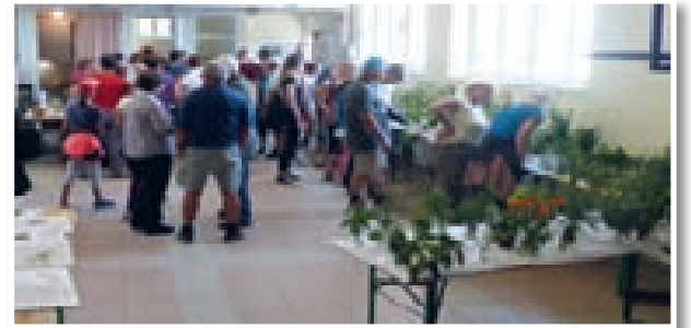
Razstava zdravnih zelišč

Občina Lenart, dogodek se izvaja v okviru projekta »DETOX«, ki je podprt s strani Evropske unije in sofinanciran iz Evropskega sklada za regionalni razvoj v okviru Programa sodelovanja Interreg V-A Slovenija-Hrvaška 2014-2020.