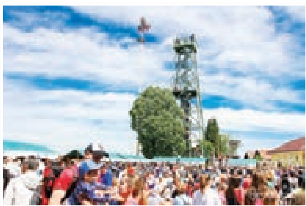
Množica v Zavrhu, foto: Maksimiljan Krautič

Za pohodnike je bila na voljo tudi pokušina Agatinega sira, završkega kruha in Katinoga soka. Društvo vinogradnikov Lenart se je letos še posebej potrudilo in k sodelovanju