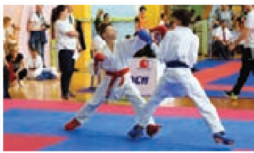
Vid (rdeči pas) v akciji

boju za tretje mesto izgubil z rezultatom 0:1 proti državnemu prvaku Črne gore.