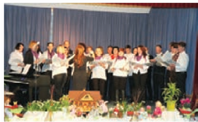
Pevski zbor Musica Benedikt

pojasnjeno bomo razumeli in ločili med obema naznaniloma. V vseh harmonijah odnosov, melodij, odzvanjanj se skriva veliko več; lahko nam sedanje pomanjkljivo preprosto le zadostuje in se prebijamo iz dneva v dan – lahko pa odstreemo nejasnosti in naredimo korak k ujemanju. Vse omenjeno terja veliko mero razumevanja in tudi samoodpovedovanja. V glasbeni terapiji zvok uporabljamo kot medij za odklepanje amygdale, ki je glavni odločevalec za odločanje v stresni situaciji: ali bomo »zamrznili« ali pa »pobegnili«. Zvoki, ki jih prejemamo preko besed, melodij, iz narave, so sestavni del našega počutja. Za delo pri društvu si želim, da izrekamo dobrotne in ljubeče besede, pa čeprav so kdaj trde in odločne, da okolje zveni v ujemanju ter da bi tam, kjer bivamo, radi bivali. Prav tako si v društvu želimo, da se ljudje vključujejo v skupne aktivnosti v kraju, kamor spada tudi petje v pevskem zboru in učenje instrumentov. Karkoli počnemo, za karkoli se odločamo, nad vsem naj bo ljubezen – do nas, do družine in kraja in spomnimo se, da se v mnogem odločamo tudi v dobro naših potomcev.