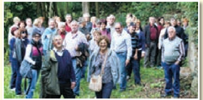
Z lanske ekskurzije v Padno

samostansko knjižnico, za kateri že več kot 200 let skrbijo očetje frančiškani. Sledi ogled sadjarske kmetije, kjer bomo okušali briške češnje in spoznali delovanje LAS V objemu sonca, njihove projekte in primere dobrih praks. Že rahlo utrujeni si bomo privoščili okusno kosilo na Turistični kmetiji Malovščevo, ki obsega vrsto okusnih kulinaricnih dobrot, postreženih v lepem ambientu ob prijetnem vzuđu. Ukvarjajo se tudi z vinogradništvom, pred nekaj leti pa so kmetijo dopolnili z novo sodobno predelovalnico in sušilnico mesnin. Zadnji postanek z degustacijo kakovostnih primorskih vin bo v vinski kleti Vipava 1894. To leto je bilo prelomno za vinogradništvo v Vipavski dolini, saj so tedaj ustanovili prvo vinsko klet na Slo-