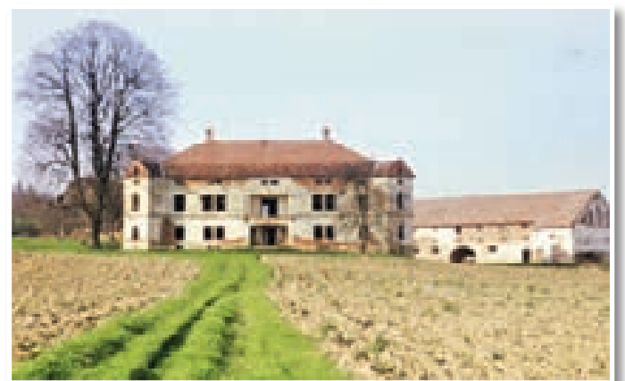
Zaradi nespametne politične odločitve preteklega sistema smo izgubili dragoceno znamenitost – Čolnikov dvorec. Njegov kozolec je zadnja možnost, da veliko krivico vsaj delno popravimo.