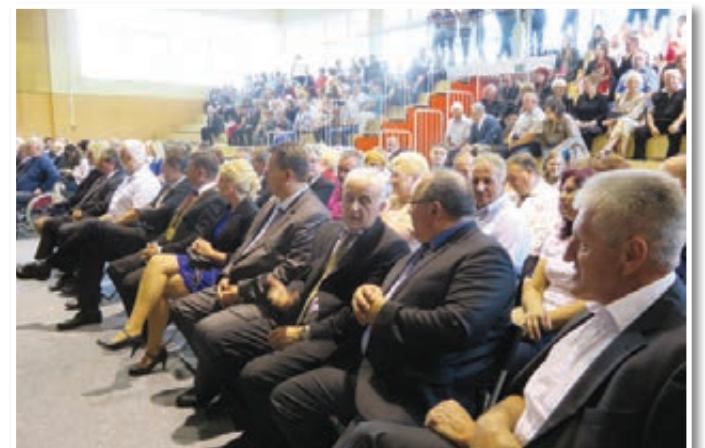
Udeleženci proslave ob dvanajstem prazniku Občine Sveta Trojica so napolnili tamkajšnjo športno dvorano.