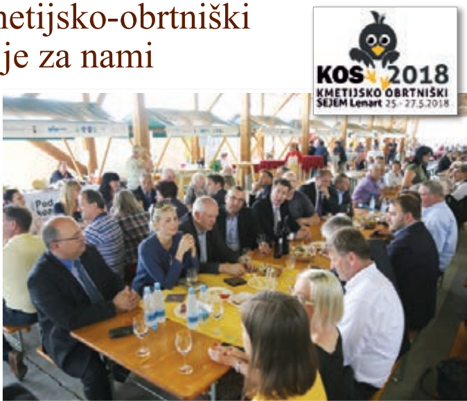
Otvoritev sejma z uglednimi gosti

Vsako leto se nam rojevajo nove ideje in to