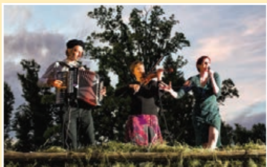
Grad gori! obuja slovenske in evropske ljudske zgodbe v sveži luči.