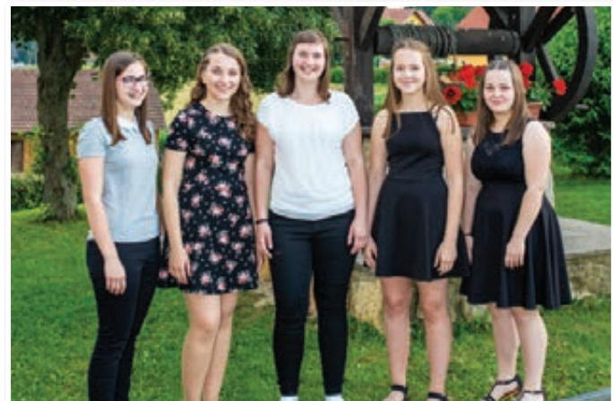
Dekliška vokalna skupina Iskrice iz Jurovskega Dola

pa smo dosegli svoj namen, če so obiskovalci kot zvesti poslušalci lepega petja v pevsko glasbenem večeru vsaj za trenutek začutili, da naša sreča ni le v vsakdanjih opravilih, velikih delih, pehanjem za preživetje in obstoj, da je naša sreča tudi, da si znamo to življenje popestriti, obogatiti in nekaj storiti tudi za duhovno plat. Veseli smo bili, da so nas zapete pesmi povezale v eno samo sproščeno in uglašeno harmonijo tudi v druženju po prireditvi.