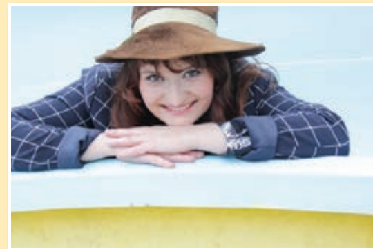
Kavarniški večer z Bilbi