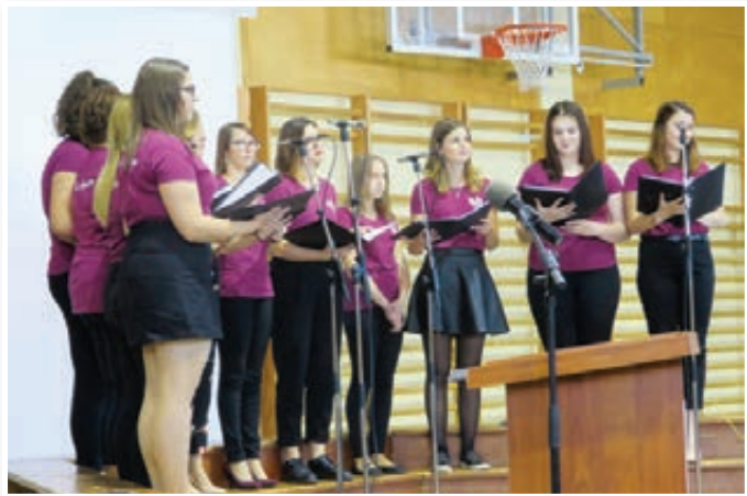
Na proslavi so izvedli izredno bogat kulturni program, v katerem je sodeloval tudi pevski zbor Vox Angelica.