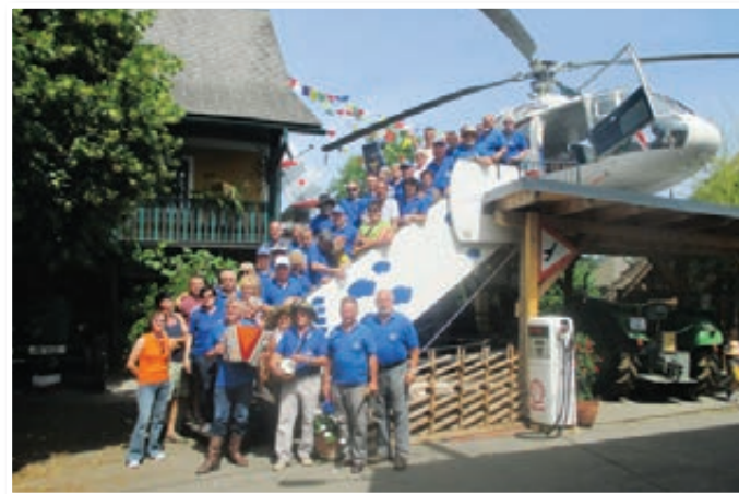
Za polet s helikopterjem nas je bilo preveč.

dediščine vključili v štafeto od Pirana do Goriškega. S starodobnimi vozili smo kot potujoči muzeji, ki odkriva zaklade slovenskih kulturnih in tehničnih znamenitosti. Istočasno si ogledamo posamezne kraje, njih znamenitosti ter se srečujemo z ljudmi, ki skrbijo za ohr-