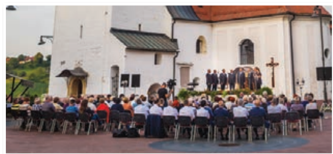
V soboto, 16. junija 2018, se je na trgu v Jurovskem Dolu odvijalo že 7. srečanje oktetov in malih vokalnih skupin.

Ob poslušanju pevskih zgodb vseh nastopajočih skupin bi lahko rekli, da se poleti pesem kar sama poje. Organizatorji prireditve