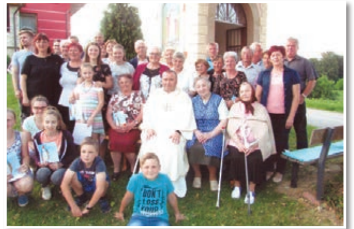
Utrinek iz Vuzmove kapele na Vardi

Na območju župnije Sv. Jurij v Slovenskih goricah so se tudi v tem letu odvijale šmarnične molitve ob vaških kapelah, na Vardi pri Vuzmovi kapeli, pri Gorjupovi kapeli in pri Zorečevi-Toplakovi kapeli v Zg. Partinju. Molitvena šmarnična pobožnost je potekala vsak večer v mesecu maju. Poleg ostalih vaščanov so tudi tokrat glavno vlogo odigrali učenci OŠ Jožeta Hudalesa Jurovski Dol, saj so prebirali šmarnične odlomke in molili litanije. Ob koncu meseca maja je bila pri vseh treh kapelah opravljena zahvalna mašna daritev in vsi, ki so se redno udeleževali te tradicionalne pobožnosti, so prejeli pisne zahvale. Ob koncu pa so se la-