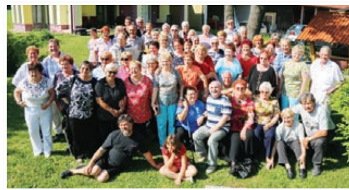
Udeleženci srečanja radijskih poslušalcev Snopa v Zg. Žerjavcih