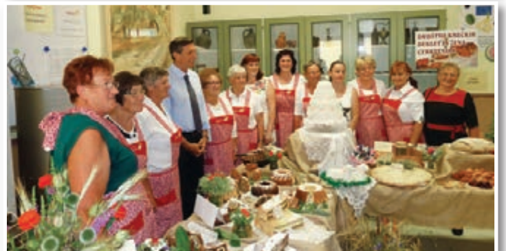
Osrednja proslava trojiškega občinskega praznika s podelitvijo priznanj in nagrad je bila 25. maja, najmnožičnejša prireditev pa kvaternica v nedeljo, 27. 5. V Cerkevniku je bila v nedeljo, 17. 6., povorka starih običajev, osrednja proslava s predsednikom RS Borutom Pahorjem in množično druženje.