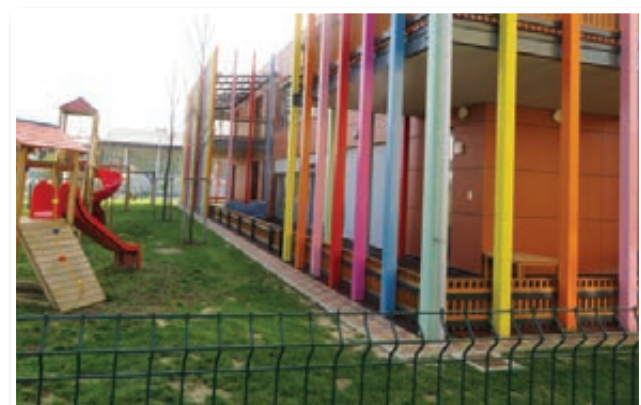
Vrtec v Benediktu, ki je tako po svoji predšolski vzgoji kot po zunanjem videzu v ponos kraju in občini, bo na začetku naslednjega šolskega leta oblikoval nov oddelek, tako da jih bo imel skupaj kar osem.