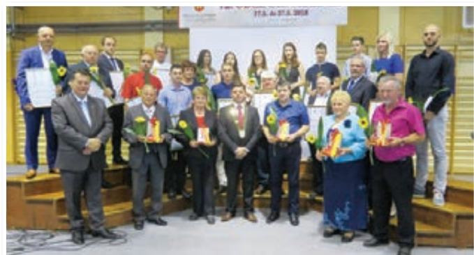
Skupinska fotografija prejemnikov priznanj in zahval Občine Sveta Trojica, županovih priznanj ter najboljših dijakov, študentov in podiplomcev iz Svete Trojice.