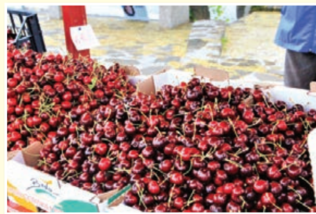
Za praznik češenj Brda obiše okoli 30 tisoč obiskovalcev.