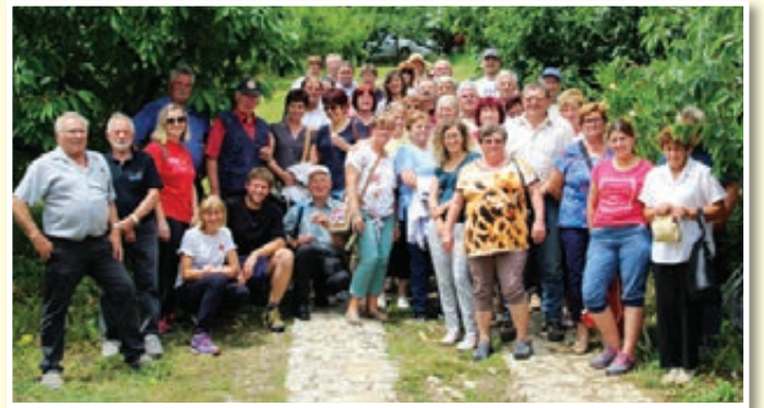
Skupinska fotografija v nasadu češenj