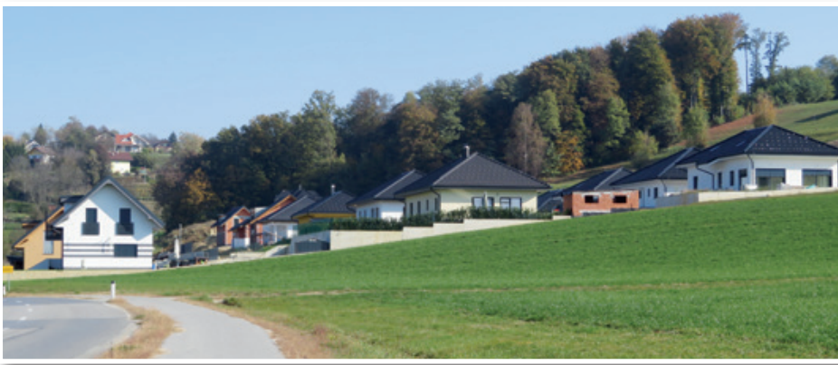
Novo naselje na vzhodu Benedikta pod Svetimi Tremi Kralji, ki ga gradi podjetje Juven, se hitro širi. Doslej so v njem zgradili že 26 družinskih hiš.

podjetje Juven v naselju B-15 v Benediktu v tem času intenzivno gradilo družinske hiše za trg in znane kupce. To na eni strani priča o visoki kakovosti in primernih cenah Juvenovih hiš, po drugi strani pa o tem, kako je postal Benedikt zanimiv za naseljevanje zlasti mladih družin. Po besedah Bratuševa so večino hiš v naselju B-15 kupile mlade družine. »Pri tem, ko so se kupci odločali za nakup hiše v Benediktu, so imeli pred očmi tudi, da imamo v naši občini dober vrtec in dobro osnovno šolo, sodobno športno dvorano, po novem tudi zdravstveno ambulanto, urejeno komunalno in prometno infrastrukturo, še zlasti pa veliko zelenih površin v samem kraju in okolici. Zelo pomembno je tudi, da je vse omenjeno blizu oziroma v tako imenovani peš coni.«