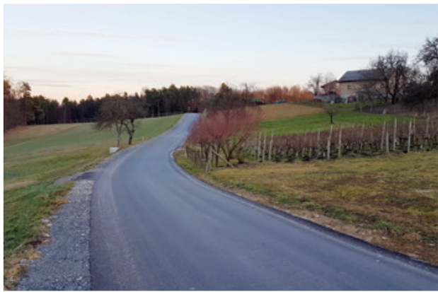
Velik poudarek v preteklih letih v Juriju je bil na obnovi dotrajanih občinskih cest.

Občina Sv. Jurij v Slov. gor. je v zadnjih 12-ih letih naredila velik korak naprej na področju cestne infrastrukture. Tako je bilo v jurovski občini v tem obdobju na novo asfaltiranih 30 km občinskih cestišč.