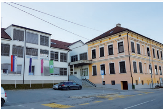
V jurovskem vrtcu z letošnjim letom deluje 5 oddelkov.

Prav tako pa se je ob dobrem sodelovanju z Direkcijo RS za infrastrukturo obnovil večji del državne ceste, ki pelje skozi jurovsko občino. Velik investicijski vložek pa je bil namenjen tudi sanaciji plazov ob državni cesti in lokalnih cestah.