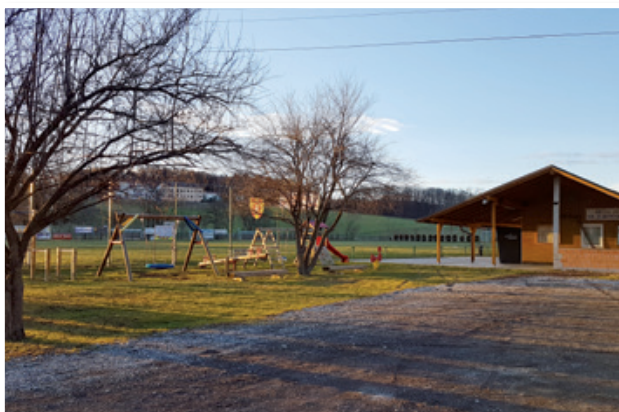
Športni park bo v letošnjem letu obogaten s fitnesom na prostem.

in rekonstrukcijam najbolj poškodovanih občinskih cest. Prve večje investicije v cestno infrastrukturo se bodo izvajale že v tem koledarskem letu s pričetkom v pomladanskih mesecih, oz. takoj ko bodo tovrstna dela dopuščale vremenske razmere. V letošnjem letu se bo tako zaključila rekonstrukcija občinskih cest – III. faza. Med pomembnejšimi projekti, ki čakajo občino v tem koledarskem letu, je tudi ureditev prometne varnosti v Jurovskem Dolu.