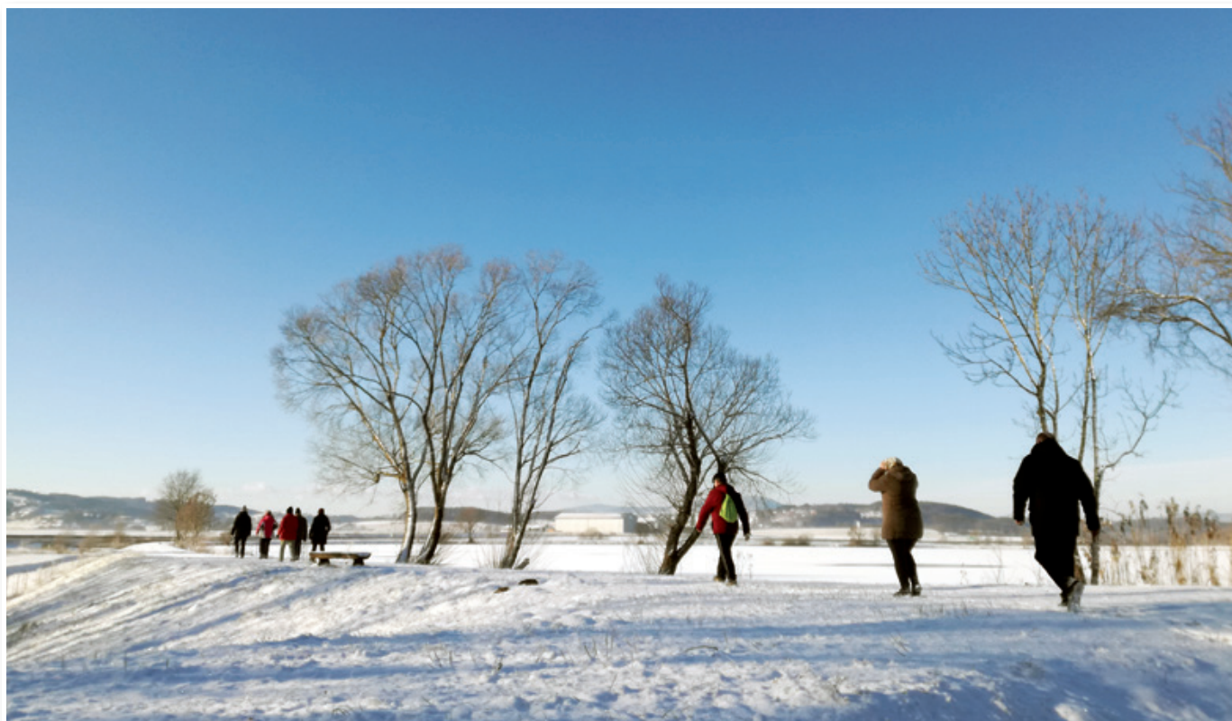
Ena redkih lenarških »belih razglednic« v tej zimi. Člani Študijskega krožka Lahkih nog naokrog Izobraževalnega centra Slov. gorice so 4. 1. 2019 v okviru rednih pohodov opravili pohod okrog jezera Radehova.