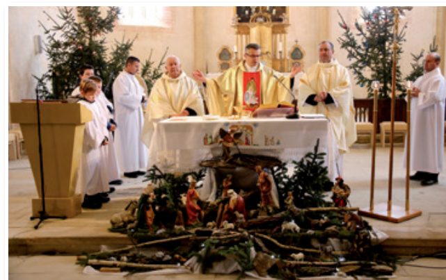
Daritev žegnanjske sv. maše v cerkvi Sv. Treh Kraljev