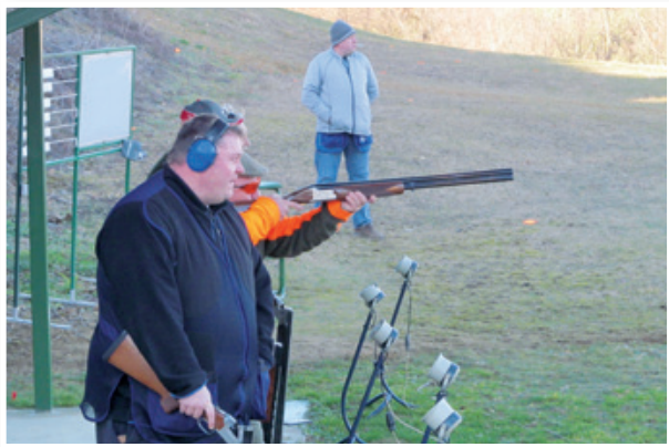
Na strelišču v Oseku