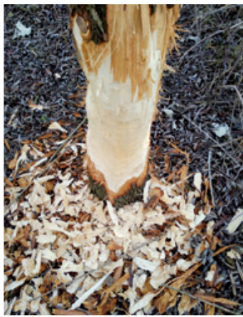
Bobrišče v mokrišču Globovnice pred Lenartom