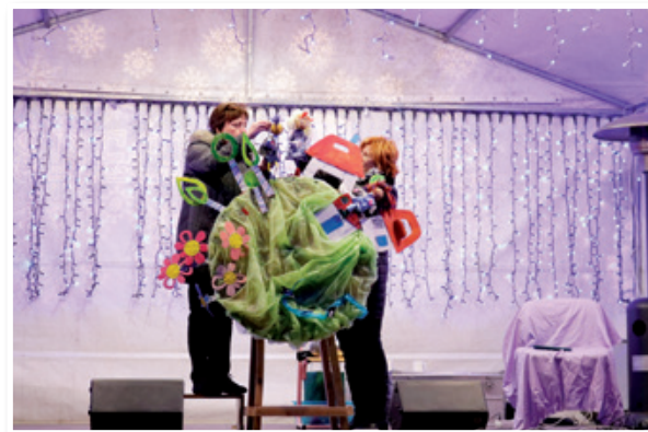
Predstava Katka in polžka, Lutkovna skupina Tin in jaz (pa on)

D. O.