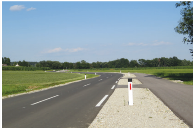
V Občini Sveta Ana so zgradili pločnike in modernizirali veliko cest, sedaj pa nekateri brezobzirni vozniki po njih tako divjajo, da v nekaterih naseljih že predlagajo namestitvev hitrostnih ovir.