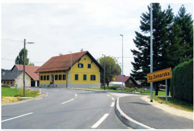
Modernizacija ceste in izgradnja pločnika skozi Spodnjo Senarsko se končuje.

senskih dneh na gradbišču nove soseske Trojica jug kot na mravljišču, saj intenzivno potekajo gradbena dela. Nova soseska raste hitreje, kot so mnogi pričakovali, saj se v celotni Sloveniji po večletni krizi v gradbeništvu ponovno veliko gradi.