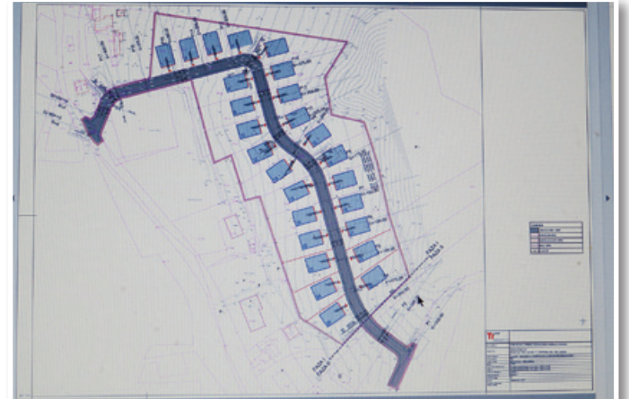
Iz občinskega podrobnega prostorskega načrta je razvidno, da je v novem stanovanjskem naselju v Lokavcu 26 parcel za stanovanjsko gradnjo.