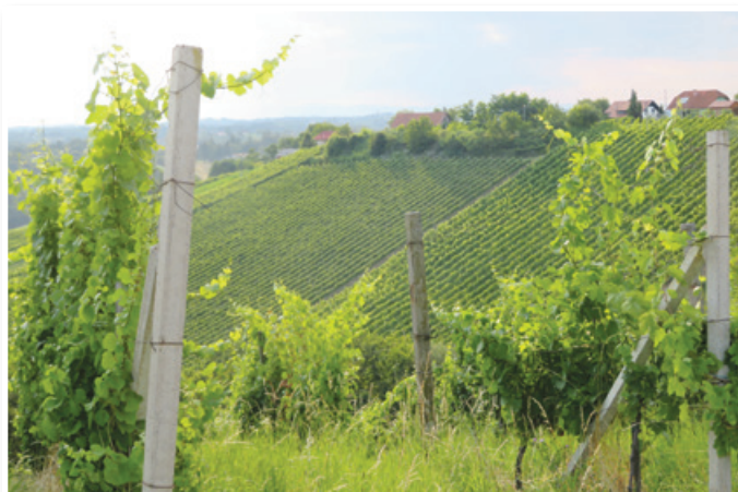
Turiste, še zlasti v tem jesenskem času, v Občino Sveta Ana vabijo tudi čudovite vedute osrednjih Slovenskih goric, ki so posejane z vinogradi.