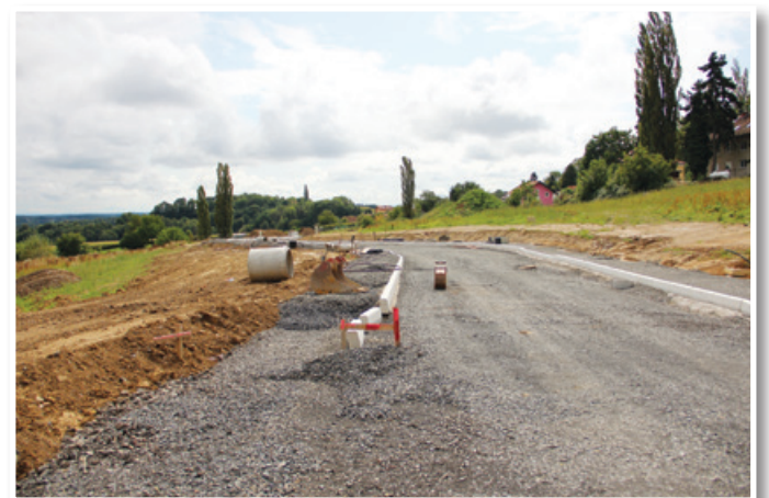
Novo oziroma bodoče stanovanjsko naselje v Lokavcu je že komunalno opremljeno.