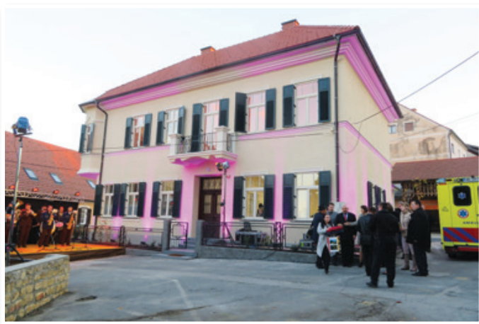
V najlepši zgradbi v Sveti Trojici bo še naprej delala zdravstvena ambulanta. Ker je Zdravstveni dom Lenart zaradi pomanjkanja zdravnikov ne more več zagotavljati, jo bo občina ohranila z dodelitvijo koncesije za opravljanje javne službe v osnovni zdravstveni dejavnosti.

Občina, ki je po zakonu o zdravstveni dejavnosti pristojna za zagotavljanje primarne zdravstvene dejavnosti, ki jo opravljajo javni zavodi ali zasebni izvajalci s koncesijo, lahko namreč po omenjenem zakonu koncesijo podeli samo, če njeno podelitev uredi z odlokom. To določilo je prinesla novela zakona o zdravstveni dejavnosti, ki je bila v državnem zboru sprejeta leta 2017.