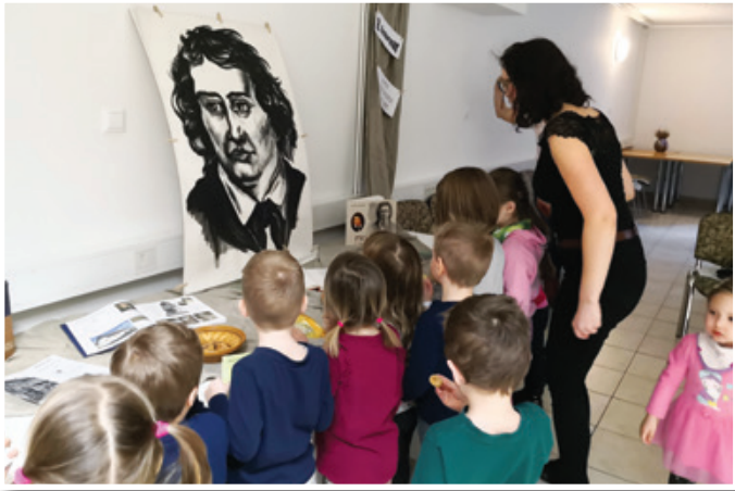
Vrtec Lenart na obisku v Tednu kulture

Pomlad sicer prinaša morda nekoliko manj časa za branje, saj nas sončni žarki že vabijo na plano, navdušene vrtnarje pa na vrtove in njive. Nepogrešljivi pripomoček bo zagotovo mesečni setveni koledar, ki ga najdete v mesečniku Moj mali svet tudi med našimi revijami, in še številni nasveti za prva opravila na prostem. Veliko nasvetov pa vsako sredo prinaša tudi Kmečki glas . Ne spreglejte pa tudi številnih vrtnarskih priročnikov na naših knjižnih policah.