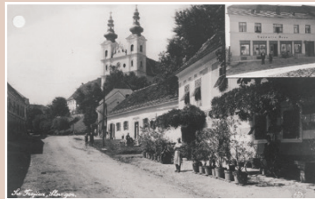
Sveta Trojica v Slovenskih goricah 1928

svojo moč v nadvladovanju Slovencev predvsem s svojim kapitalom po mestih in trgih, ki so jih zaradi ponemčenega meščanstva imeli za svoje poglavitne postojanke sredi "slovenskega morja" in za glavna oporišča pri ponemčevalnem delu med slovenskim podeželskim prebivalstvom 2 . Mesta in trgi na Štajerskem (vsaj večina), so ostali nemška oporišča vse do razpada Avstro-Ogrske leta 1918. Spodnještajersko nemštvo z nemškutarstvom vred je imelo trdno oporo v dunajski vladi, v štajerskem deželnem namestništvu, v okrajnih glavarstvih, skratka v vsem birokratskem aparatu vse tja do podeželskih davkarij, finančnih straž in žandarmerij, saj so v tem aparatu le redki spodnještajerski Slovenci prišli na važnejši položaj. Še pomembnejša opora, ki so jo imeli Nemci v državnem aparatu, pa je bila opora, ki so jim jo nudila samoupravna in zakonodajna telesa (državni zbor, štajerski deželni zbor in okrajni zastopi, ki jih je Štajerska poznala od leta 1867). Občinski