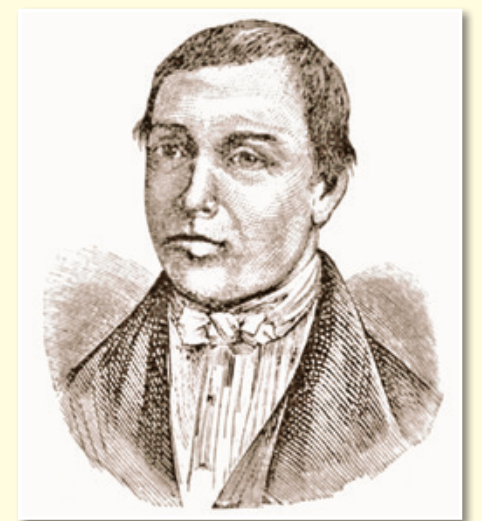
Franc Xaver Trummer (1800–1858), portret je prvič objavljen v Sloveniji. Vir risbe: Goethe Herman: Franz Xaver Trummer. Eine Biographische Skizze (z risbo portreta), Die Weinlaube: Zeitschrift für Weinbau u. Kellerwirtschaft, str. 425–426, Dunaj, 1875.