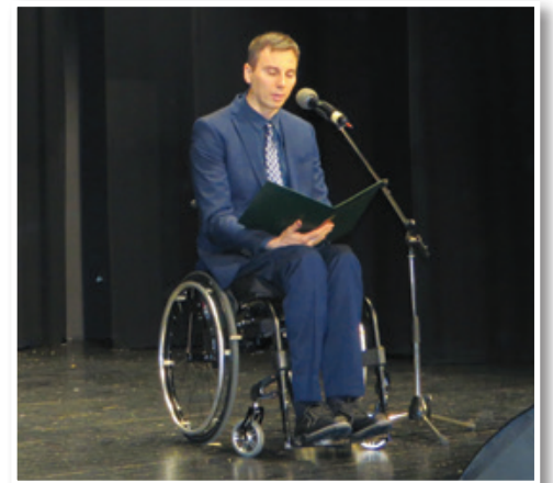
Pisatelj Igor Plohl