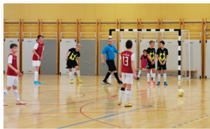
Selekcija U13 iz Ljubljane z remijem proti Olimpiji