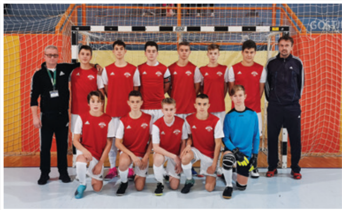
Ekipo KMN Slovenske gorice U17 pričela končno za prvaka z zmago