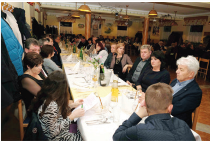
Del omizja s člani in jubilarci OOOZ Lenart, njihovimi družinskimi člani ter prijatelji

Lenart, Sveta Ana, Sveti Jurij v Slovenskih goricah ter Sveta Trojica v Slovenskih goricah.