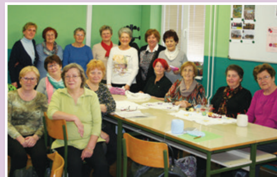
ŠK Ročne spretnosti, I. skupina

Udeležence skupin ROČNIH DEL se na Izobraževalnem centru redno srečujejo in ustvarjajo čudovite izdelke, ki jih bodo razstavile v sredo, 25. 3. 2020 , v avli občine Lenart. Vljudno vabljeni! Izobraževalni center Lenart T: 02 720 78 88 ali 051 368 118 E: izobrazevalnicenter.slogor@gmail.com