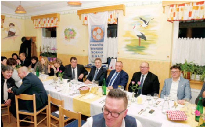
Del omizja z vabljenimi gosti na 40-letnici OOOZ Lenart v gostinskem lokalu družinskega podjetja Gostinstvo in turizem Breznik, d. o. o., v Komarnici v Cerkevniku