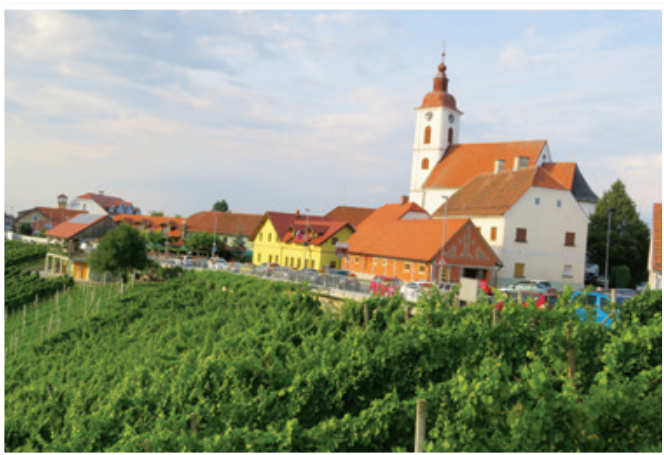
Občina Sveta Ana s svojimi vedutami sodi med najbolj slikovite kraje v tem delu Slovenije, zato postaja za turiste in druge obiskovalce čedalje bolj zanimiva.