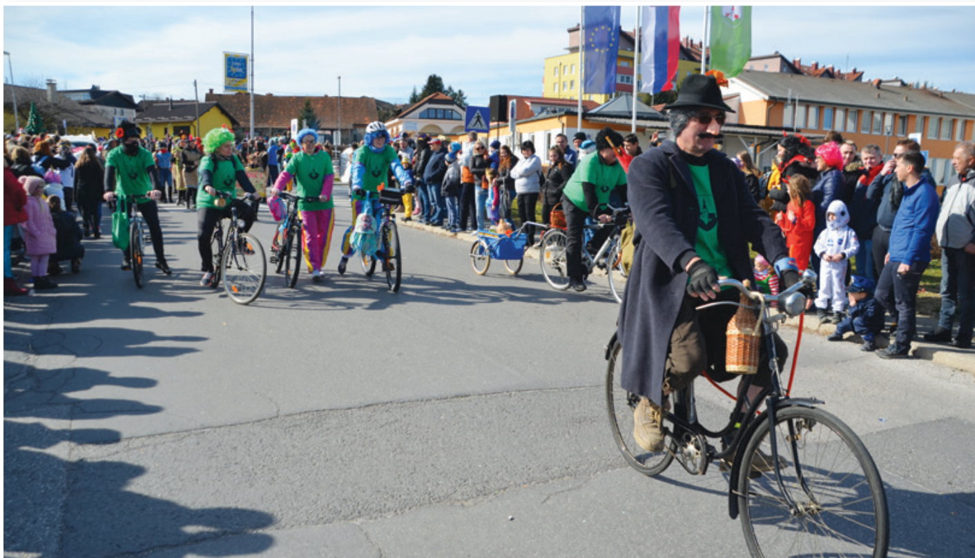
29. Pustovanje v Lenartu v soboto, 22. 2. 2019, je zaznamovalo in popestrilo več kot 1600 maškar v pustni povorki, dogajanje pa je privabilo več tisoč obiskovalcev. Več na str. 10.