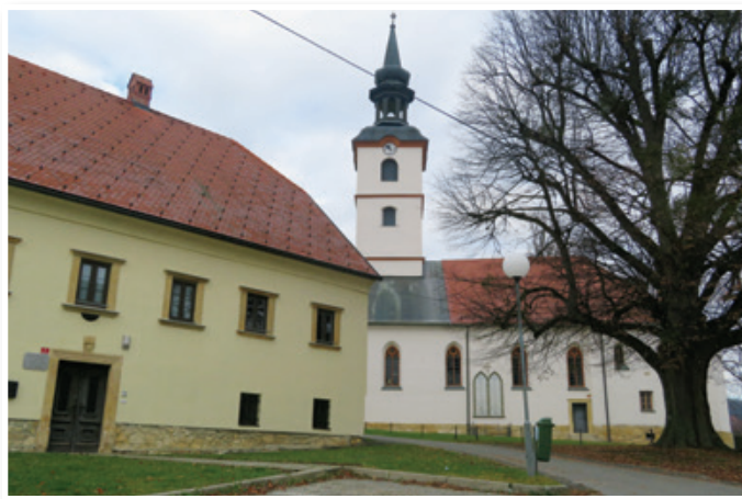
V Občini Benedikt ohranjajo bogato kulturno dediščino in vzorno skrbijo za razvoj kulture, za kar imajo veliko zaslug kulturna društva.