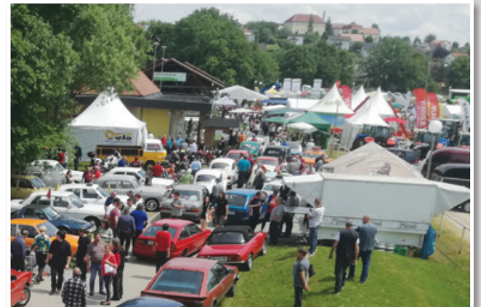
Tako je bilo na Poleni lani.