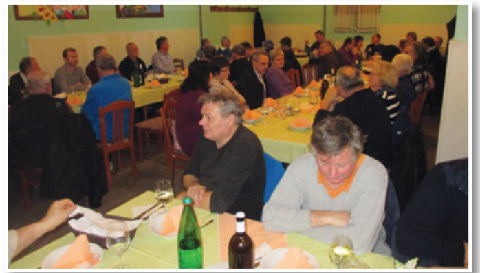
Ob 18. rojstnem dnevu kluba