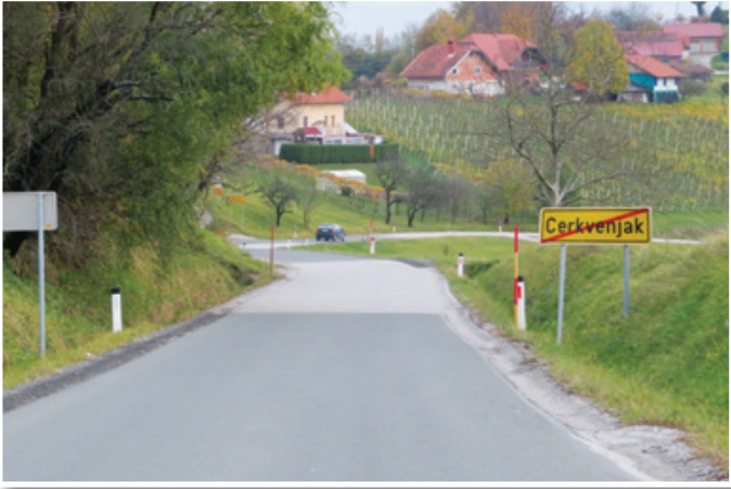
V Občini Cerkevnik bodo zgradili nov pločnik z javno razsvetlavo od Tušakove vile do odcepa za Stanetinec.

V letu 2020 načrtujejo tudi izvedbo prve