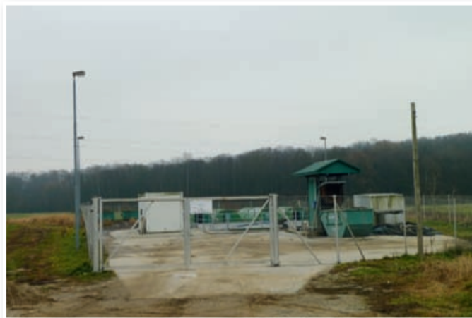
Centralna čistilna naprava ob Velki

naše občine. V občini Lenart je 5 čistilnih naprav, štiri so v lasti občine. Tista v naselju Močna za 50 gospodinjstev deluje, ena v Voličini in dve v mestu Lenart pa delujeta pod 20 odstotki, praktično torej ne. Zgodbe o centralni čistilni napravi verjetno ni treba ponavljati. Občino je pred leti stala okrog 800 tisoč evrov, izvajalec pa zanjo nikoli ni uspel pridobiti uporabnega dovoljenja. Je v stečaju in zadeva je na sodišču.