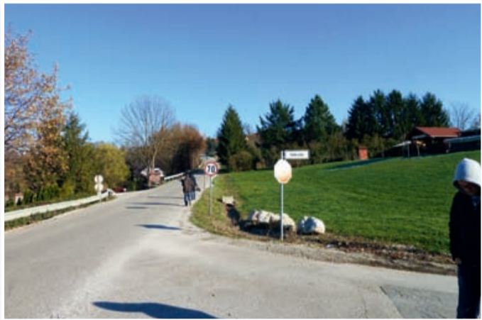
Do znižanja odhodkov iz občinskega proračuna je prišlo predvsem zaradi zamika izgradnje kanalizacije in čistilne naprave v Zgornji Senarski.

prenesla na podjetje Saubermacher. Kapitalški prihodki občinskega proračuna pa so se zmanjšali, ker občina ni prodala stavbe in zemljišča ob jezeru. Do sprememb je prišlo tudi pri transfernih prihodkih, zlasti zaradi sprememb v dinamiki financiranja oziroma sofinanciranja nekaterih projektov.