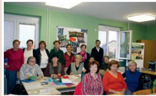
Člani študijske skupine Ročne spretnosti

Naše praznovanje je imelo humanitarno noto, del sredstev od prodanih vstopnic smo namenili v sklad za pomoč socialno ogrože-