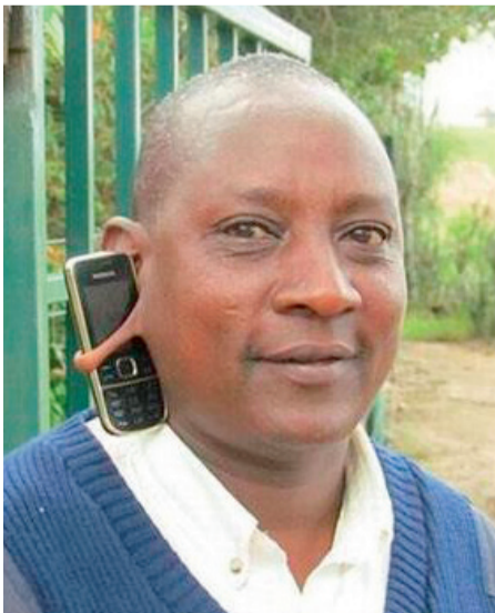
Nosilec za mobilni telefon ... sneto s spleta

»Jaz pa se spomnim, kako sem nekoč šel z očetom v park, domov pa sem se vrnil z mamico.«