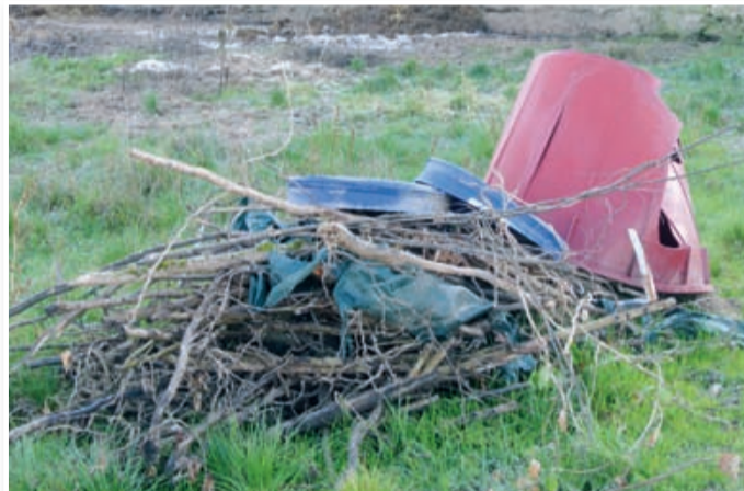
Kup plastike za sežig. To je škodljivo! Kdo to lahko prepreči?