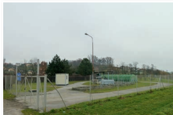
Čistilna naprava ob Globovnici

infrastrukturnih problemov. Po drugi strani pa je predpis, da se mora upravljanje čistilnih naprav zaračunavati povzročiteljem, torej gospodinjstvom in industriji. Oboji smo torej dolžni plačevati čiščenje in investicijo, ki je