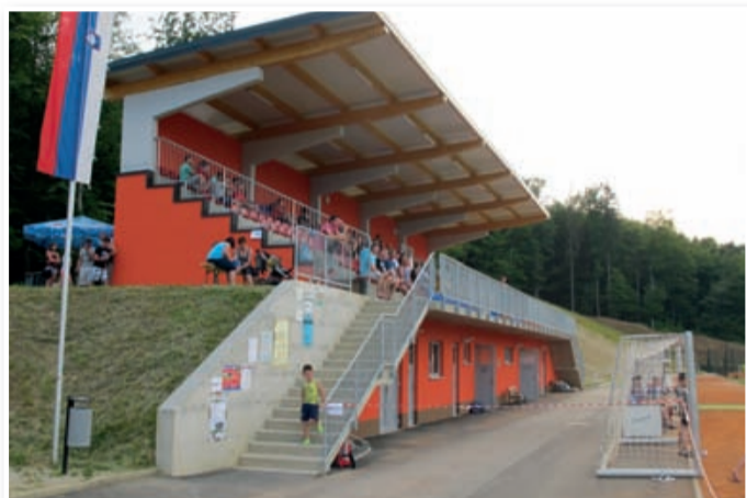
V ŠRC Cerkevjak bodo uporabniki lahko vzeli v najem nogometno igrišče (glavno in pomožno), tenis igrišče, strelišče, atletske steze in garderobe.

Katera igrišča oziroma objekti so v centru na voljo uporabnikom? Gre za travnato glavno nogometno igrišče z dimenzijami 103 krat 66 metrov, za pomožno travnato nogometno igrišče z dimenzijami 85 krat 47 metrov, za tenis igrišča dimenzije 18 krat 36 metrov, za atletske proge dimenzije 120 krat 5,04 metra, za strelišče, garderobe, sanitarije in tuš kabine ter za športno in drugo opremo.