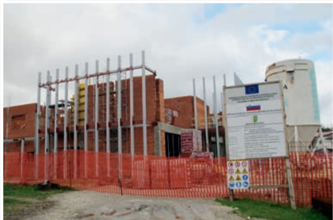
Novi vrtec v središču Benedikta hitro raste.

Od prihodkov proračuna bodo oblikovali tudi proračunsko rezervo v višini 10.700 evrov, ki je namenjena pokrivanju stroškov ukrepov in pomoči ob morebitnih naravnih nesrečah (suša, potres, požar, poplava, epidemija,