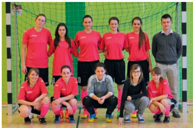
Ženska futsal ekipa Slovenskih goric

Pred prvim turnirjem in prvima dvema kroga v Sodražici je bilo na vseh straneh veliko ugank. V taboru Slovenskih goric posebnih pričakovanj niso imeli, saj je ekipa v povprečju najmlajša (manj kot 17 let) in so tako izkušnje na strani konkurentk. To se je pokazalo tudi