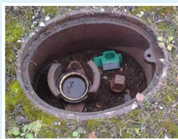
Podzemni hidrant (manjka pokrov)