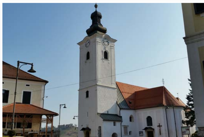
Na trgu pred cerkvijo sv. Jurija bo na Jurjevo nedeljo ponovno zelo živahno.

bo tako potekala v petek, 24. aprila 2015. Tradicionalna Jurjeva nedelja z blagoslovom, ki vsako leto pritegne množico obiskovalcev iz Slovenskih goric in tudi od drugod, pa bo letos 26. aprila 2015.