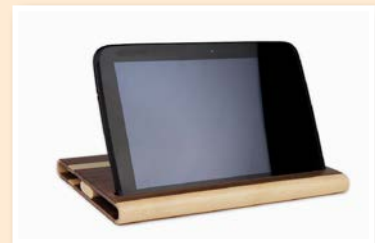
Woodpad, slovenski izdelek za pametne telefone in tablice, avtor: Jože Jurša

Poleg tega se bomo začeli povezovati zaradi boljšega skupnega nastopa na trgu in zaradi izmenjave znanja in uslug. S tem bomo zniževali stroške in izboljšali kakovost in konkurenčnost.