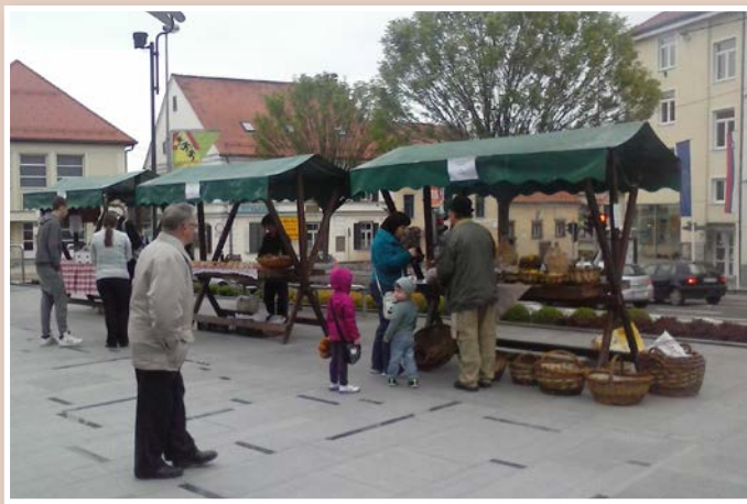
Utrinek z lanskoletnega sejma

Sejem bo potekal danes, v petek, 27. 3. 2015, od 11. do 16. ure, v soboto, 28. 3. 2015, od 9. do 13. ure in v petek, 3. 4. 2015, od 11. do 16. ure na ploščadi na Trgu osvoboditve v Lenartu.