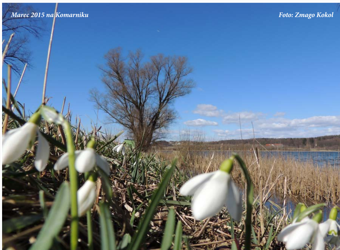
Marec 2015 na Komarniku