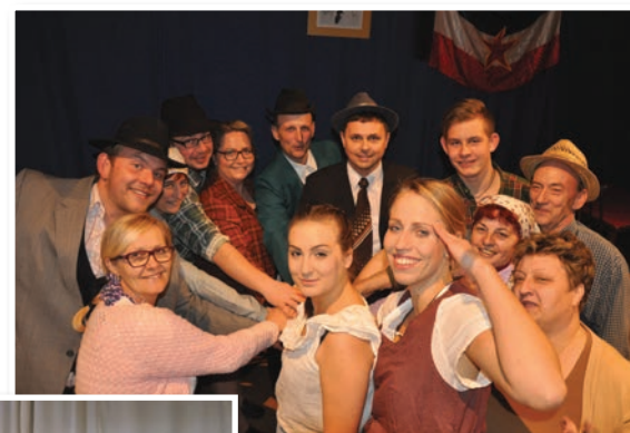
Dramska skupina Cerkvenjak