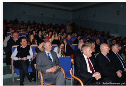
Ljubitelji športa in visoki gostje napolnili dvorano ob razglasitvi najboljših športnikov Slovenskih goric za leto 2014