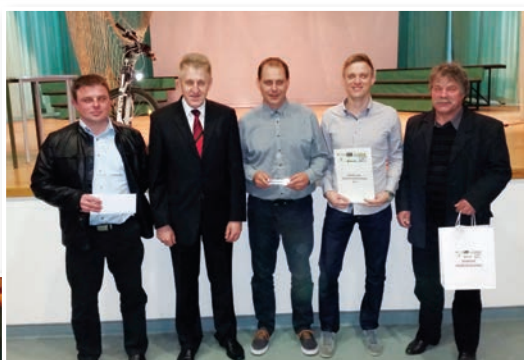
Najboljša moška ekipa - KMN Benedikt

Laskava naslova za najboljša kolektiva na območju UE Lenart sta tako v ženski kot moški konkurenci prejela futsal kluba. Tako je bila najuspešnejša ženska ekipa v minulem letu ženska ekipa KMN Slovenske gorice, ki je v