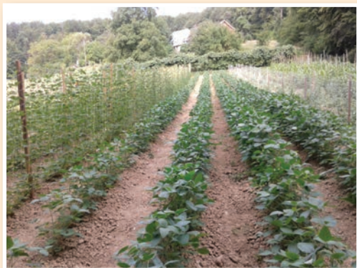
Eko zelenjavni vrt na kmetiji Živko

V sklopu projekta EKO LAS Vas vljudno vabimo na Ekološko kmetijo Živko v Voličini – na dan odprtih vrat oz. učilnico v naravi v vzpostavljenem ekološkem kolekcijskem zelenjavnem vrtu. Dogodek z delavnico in vodenjem po vrtu bo potekal v torek, 5. maja 2015, med 11. in 13. uro ter med 15. in 17. uro .