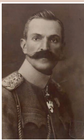
Rudolf Maister (1874-1934)

Zmanjšala je vpliv Britanskega imperija in omogočila vzpon nove svetovne sile, ZDA. Z razpadom avstro-ogrske monarhije so tudi slovenske dežele prišle pod novo, jugoslovansko državo. Žal je bila po vojni s plebiscitom za vedno izgubljena Koroška, z rapalsko pogodbo pa za dalj časa tudi doberšen del Primorske, ki ga je dobila Italija. Čeprav so bile podpisane mirovne pogodbe, pa miru v Evropi praktično ni bilo in nova vojna je nenehno visela v zraku. Velika vojna 1914–1918 torej ni prinesla nobenega miru, pač pa le dodatni razdor, novo gospodarsko krizo in politično-ideološke napetosti, ki so se s prihodom nacistov na oblast v Nemčiji leta 1933 le še stopnjevale in končale z novo svetovno vojno leta 1939.