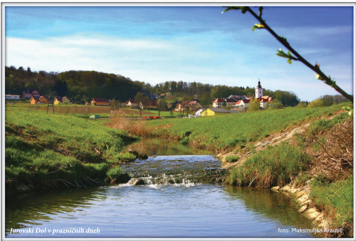
Jurovski Dol v prazničnih dneh