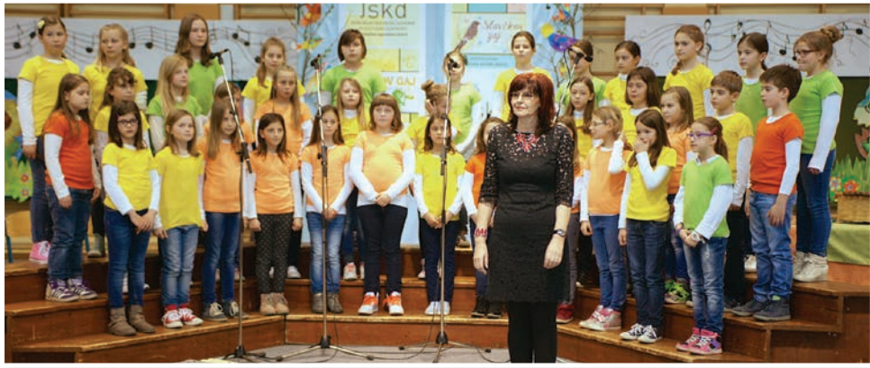
OPZ Lenart