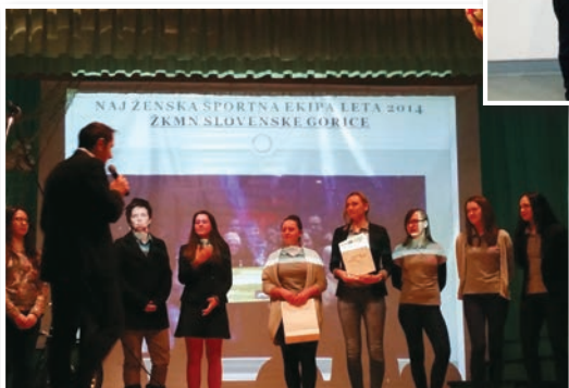
Najboljša ženska športna ekipa - ŽKMN Slovenske gorice

minuli sezoni osvojila 3. mesto v državnem prvenstvu in osvojila 2 močna mednarodna turnirja v Avstriji. 2. mesto je pripadlo prav tako nogometašicam, in sicer ŽNK Cerkevnik, 3. pa OK Benedikt. Med moškimi ekipami je bila za najboljšo ekipo izbrana ekipa KMN Benedikt, ki se je v minuli sezoni znova uvrstila v 1. SFL.