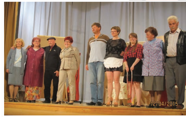
Dramska skupina KTD Selce