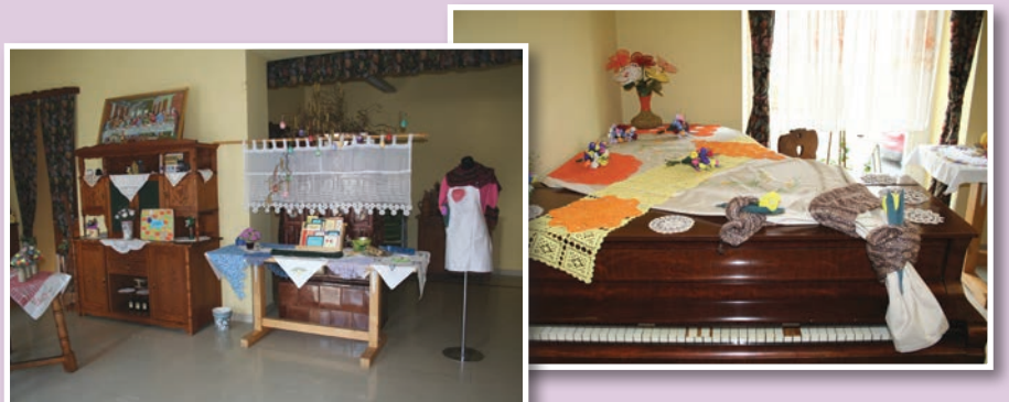
Pripravljeno za otvoritev