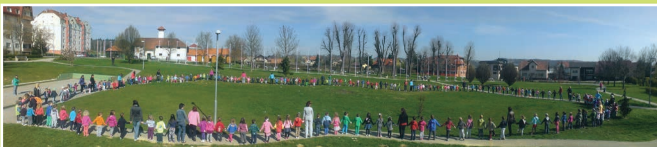
Za skupino vzgojiteljic poslala Vesna Sernec

Objeti vrnili smo se v vrtec na igrišče, tam s pomladjo se igrali ter si skupaj obljubili, da se naslednje leto v pomladnem krogu bomo spet dobili.