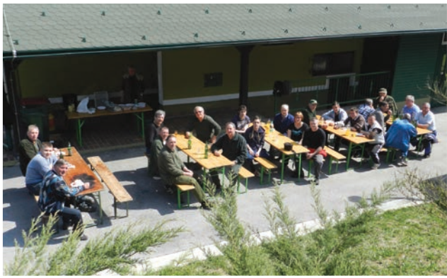
Zaključek čistilne akcije

V soboto, 11. 4. 2015, se je v občini Sv. Jurij v Slov. goricah na devetih zbirnih točkah zbralo okrog devetdeset okoljsko ozaveščenih občanov, ki so v približno štirih urah naravo olajšali za skorajda tono odpadkov. Za tradicionalno malico po končani akciji so tudi tokrat poskrbeli lovci Lovske družine Sv. Jurij v Slov. goricah.