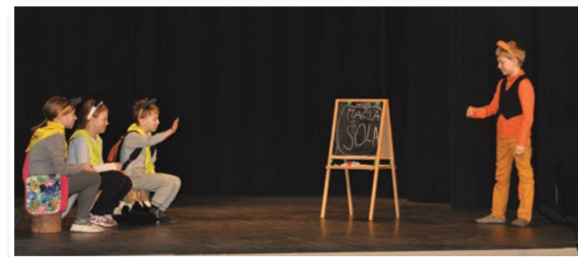
Dramska skupina OŠ Voličina s prestavo Mačja šola