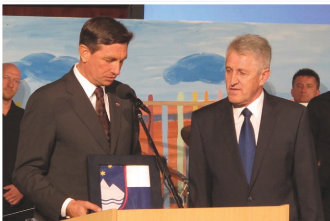
Predsednik republike Borut Pahor je Milanu Gumzarju predal slovensko zastavo za povezovanje ljudi ne glede na razlike med njimi.