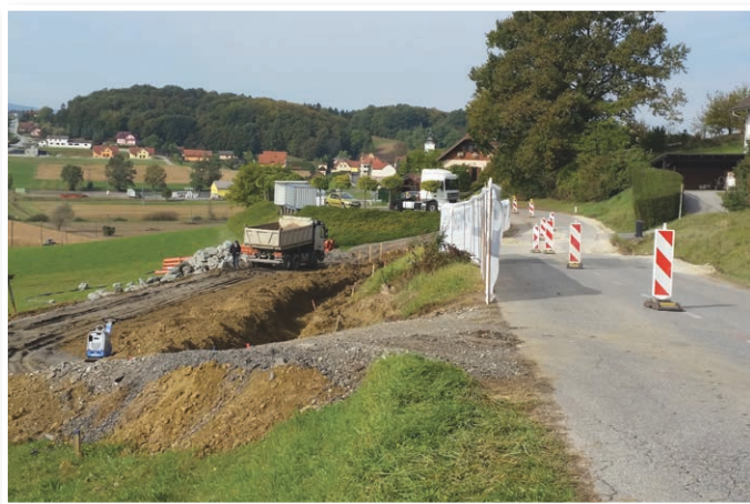
Pričetek sanacije plazov v Jurovskem Dolu

Vsebinsko Ovtarjevih novic soustvarja vse več občanov (dopisnikov). Uredništvo nenapovedane in nenaročene prispevke uporabi v celoti ali skrajšane (s prilagojenim naslovom) ali jih ne uporabi. Zadnji rok za oddajo prispevkov je 14 dni pred izidom . Obseg prispevka je praviloma 20 vrstic in ena fotografija , če bistveno dopolnjuje prispevek. Pri pomembnejših dogodkih so možna vnaprejšnja dogovorjena odstopanja. Objave lokalne skupnosti ali društev lahko obsegajo 30-50 vrstic. Prispevki naj bodo v Wordu (Times New Roman, velikost 12, razmik 1,5), fotografije morajo biti najmanj 1600x1200 pixlov, poslane v posebni datoteki. Izbor fotografij opravi uredništvo. Objavljeni prispevki izražajo stališča avtorjev. Prispevkov z elementi sovražnega govora in nepodpisanih prispevkov ne objavljamo. Naslednja številka izide v petek, 25. novembra 2016! Uredništvo