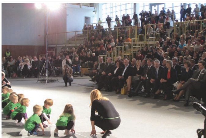
Na otvoritvi novega vrtca so se zbrali »vsi mladi in stari« iz Benedikta.

Pred otvoritvijo je bila ob 17. uri v športni dvorani slovesnost ob odpertju, na kateri so se