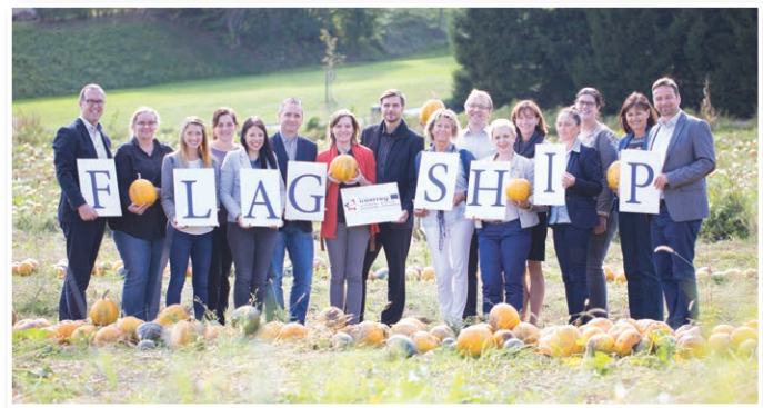
Prvo srečanje projektnih partnerjev