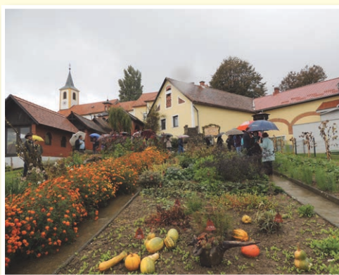
Učni vrt Društva Melisa