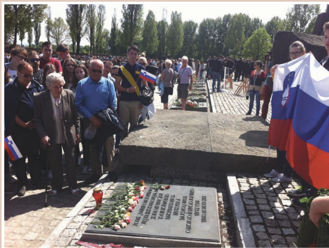
Slovenski gimnazijci med enim od obiskov Auschwitza pri spomeniku slovenskih žrtev genocida

ravni državnih in gospodarskih omrežij grede z roko v roki s krepitevijo njegovega položaja, je ob napovedi izdaje Himmlerjevega dnevnika poročala Deutsche Welle. Eden najpomembnejših zapiskov je najverjetneje ta, ki je nastal 4. oktobra 1943, ko je imel Himmler govor na srečanju voditeljev SS-a hotelu Ostland v Poznani v tedaj okupirani Poljski. Ta vnos beleži prvega od zloglasnih t.i. poznanjskih govorov, enega od redkih primerov, ko je Himmler tudi uradno razpravljal o holokavstu in je bilo to tudi zabeleženo. V tem triurnem govoru, katerega en del so prebrali tudi med nürnberškimi procesi, je Himmler med drugim dejal: "Medsebojno moramo govoriti odkrito, čeprav ne bomo nikoli govorili o tem v javnosti - mislim judovsko izselitev, iztrebitev