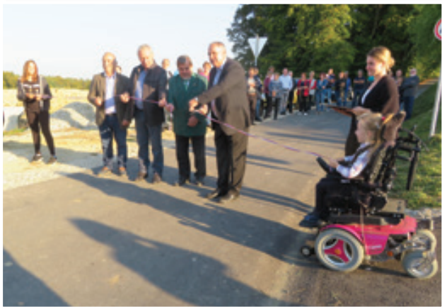
Pri otvoritvi moderniziranega cestnega odseka Brengova-Vanetina so pomagali tudi najmlajši, ki se bodo tega zanje pomembnega dogodka še dolgo spominjali.

ter občankam in občanom ob obeh cestah za potrpljenje in sodelovanje v času gradnje. Po njegovih besedah imajo v Občini Cerkljenjak 80 kilometrov lokalnih cest, ki so zelo obremenjene. Za to, da promet poteka nemoteno in varno, jih morajo redno vzdrževati. Letos je Občina Cerkljenjak za njihovo vzdrževanje namenila že 99 tisoč evrov.