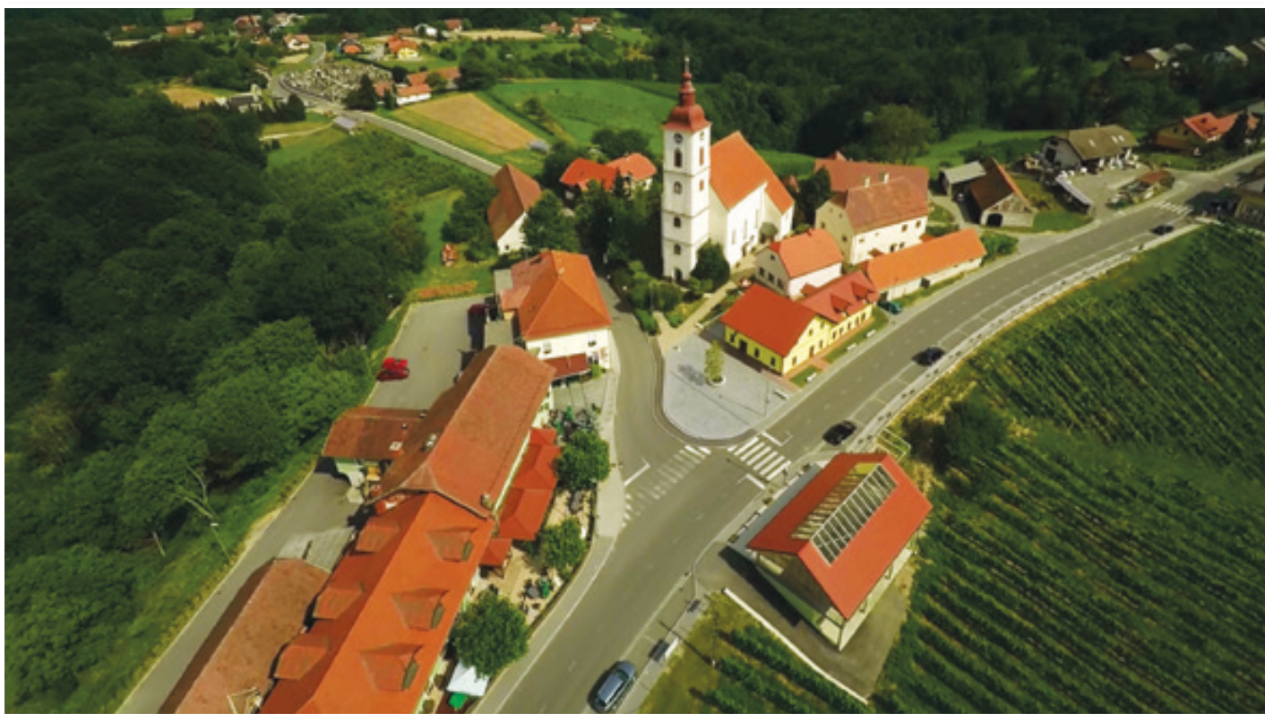
V ponedeljek, 8. oktobra 2018, je Turistična zveza Slovenije na slavnostni prireditvi v Portorožu podelila priznanje Občini Sveta Ana za doseženo 1. mesto v kategoriji trška jedra v okviru projekta Moja dežela – lepa in gostoljubna 2018 , ki se je odvijala pod pokroviteljstvom predsednika RS Boruta Pahorja.