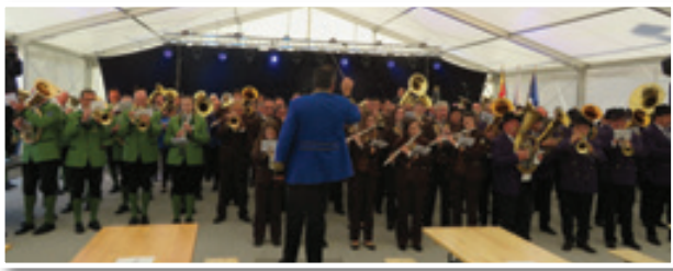
Ko je hkrati zaigralo preko 200 glasbenikov iz šestih pihalnih orkestrrov, so koračnice in druge skladbe odmevale daleč v Slovenske gorice.