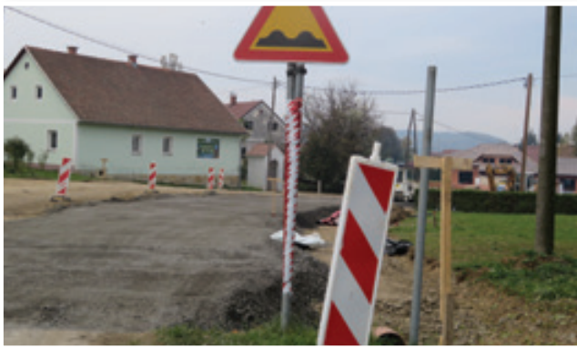
V Spodnji Senarski že mesec dni modernizirajo cesto in gradijo pločnik in javno razsvetljavo skozi naselje.

Lepo jesensko vreme tudi Občini Sveta Trojica omogoča, da intenzivno izvaja načrtovane investicije. Trenutno je največje gradbišče v občini v Spodnji Senarski, kjer so v polnem teku dela pri modernizaciji ceste ter izgradnji pločnika in javne razsvetljave skozi naselje. Investicija je »težka« preko 1,2 milijona evrov, sredstva pa sta zagotovili Direkcija Republike Slovenije za infrastrukturo in Občina Sveta Trojica.