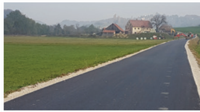
Zadnja dela na cesti Malna-Plodršnica