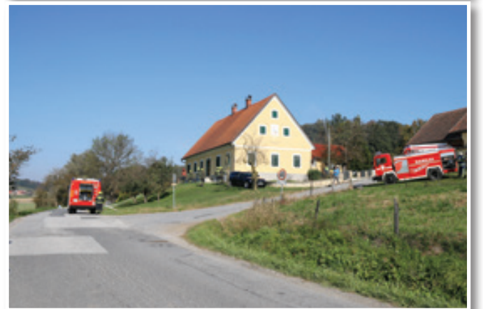
Vaja gasilskih društev v Občini Sveta Trojica pri domačiji Bunderla