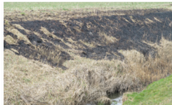
Ne uničevati, temveč varovati naravo, poudarja novi kodeks