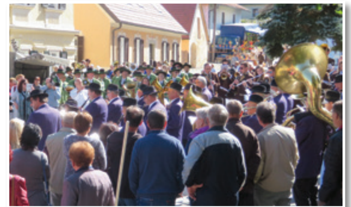
Šest pihalnih orkestrów iz Avstrije, Hrvaške in Slovenije je na osrednjem trgu v središču Svete Trojice pripravilo pravi mali koncert.

Nato so na prireditvenem prostoru skupaj zaigrali vsi pihalni orkestri hkrati. Skladbe in koračnice, ki jih je skupaj igralo več kot 200 glasbenikov, niso odmevale samo po prireditvenem prostoru, temveč po vsej Sveti Trojici