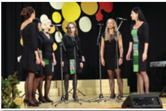
Vokalna skupina Amista