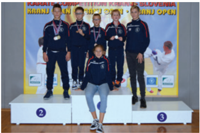
Zmagovalna ekipa v Kranju