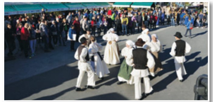
KD Vrisk iz Apač

Pravo vzdušje, kot je bilo na trgatvi nekoč, so ustvarili člani Folklorne skupine KD Vrisk iz Apač, ki so zaplesali prekmurske plesje. Ansambel S. O. S kvintet je zabaval do poznih večernih ur. Zavrhu je ta dan ponujal veliko brezplačnih doživetij, vožnjo s turističnim