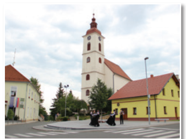
Trško jedro Sv. Ane - priljubljen prireditveni prostor